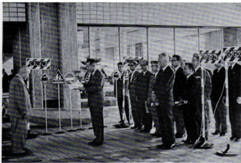
交通教室用道路標識を各学校へ贈呈