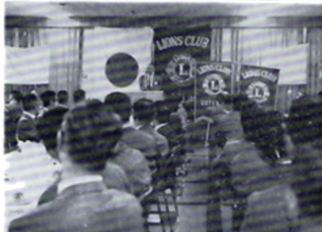
御殿場, 吉原Cと共に親子3C合同例会