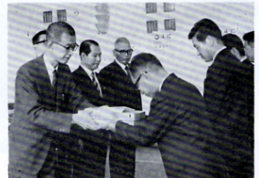
目の無料検診日に板付レンズセットを市へ贈呈