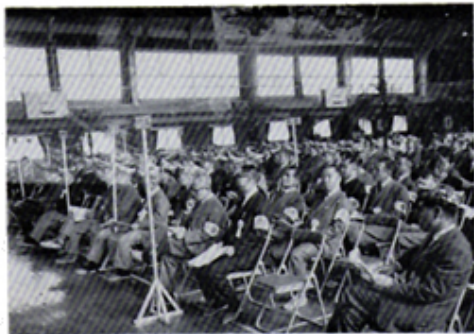
沼津千本C 結成会場風景