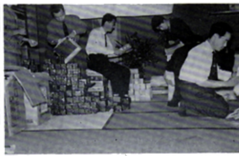
C. N.のお土産品をバックへつめる