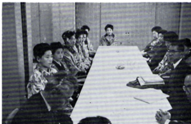
はじめてライオネスと合同例会を開く