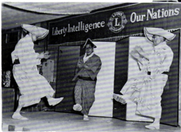
郡上踊り免許皆伝 3人男