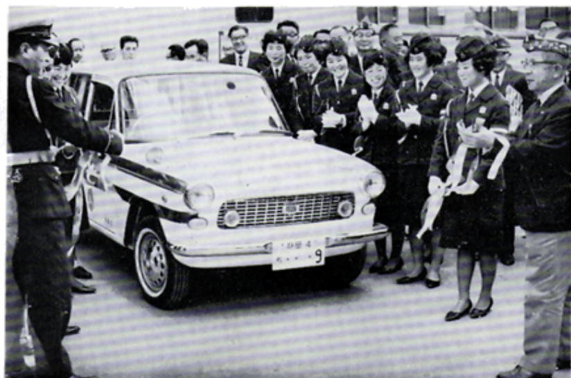
交通指導車を沼津警察署へ寄贈