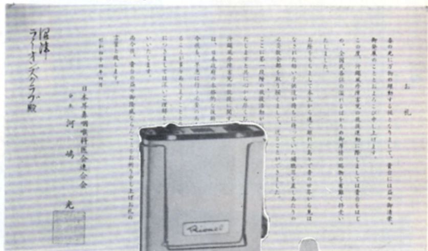
沖縄風疹障害児へ補聴器を贈る