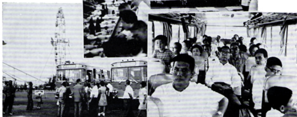
納涼家族会 於富士急ハイランド