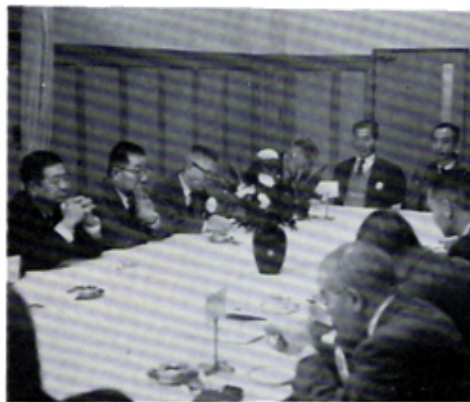
初のゾーン諮問会