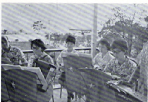
西山バンドの演奏