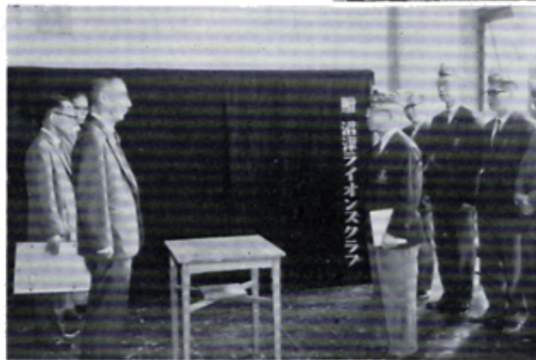
検眼用暗幕を市社協へ寄贈