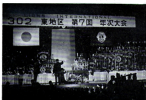
年次大会スナップ