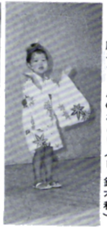
順子ちゃんのおどり (L・鈴木利)