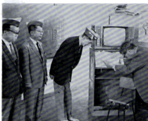
金中特殊学級へテレビ寄贈