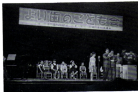
歯の衛生週間に学童へ ライオンズ賞を贈呈