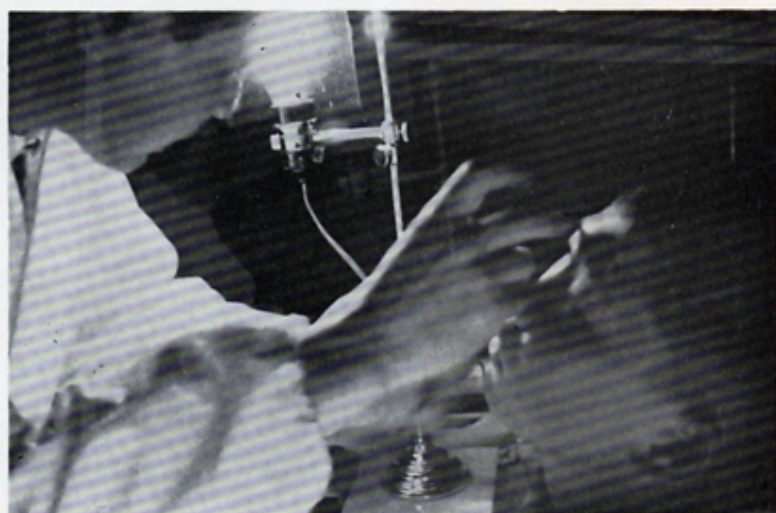
寄贈した暗室灯により検眼するし、瀬尾 於公会堂