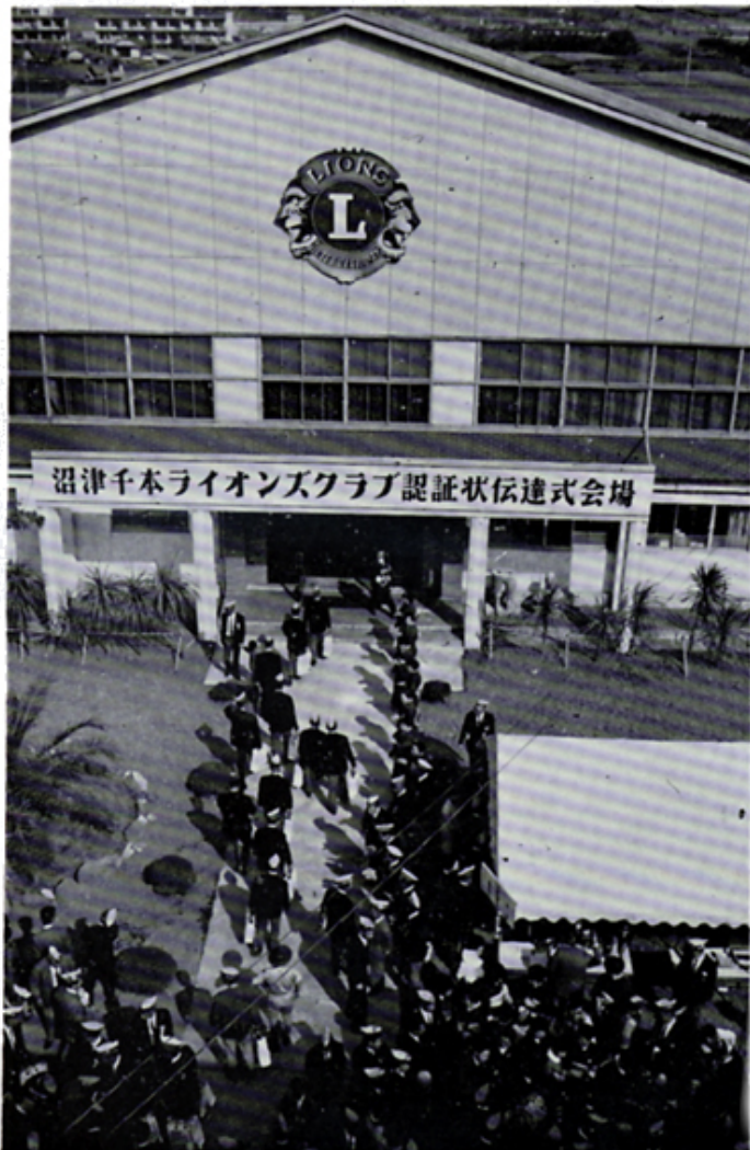
沼津千本Cのチャーターナイト