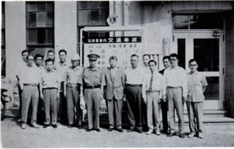
交通事故表示板贈呈