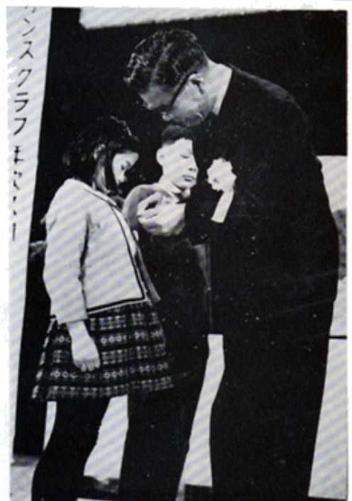
茅先生 実行章を少女に贈る