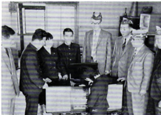
沼津盲学校へステレオ贈呈