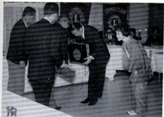
アイバンク光輪運動本部へ16ミリ映写機とフィルム“開眼”を贈呈