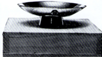
結成記念例会の席上で贈呈した銀盃