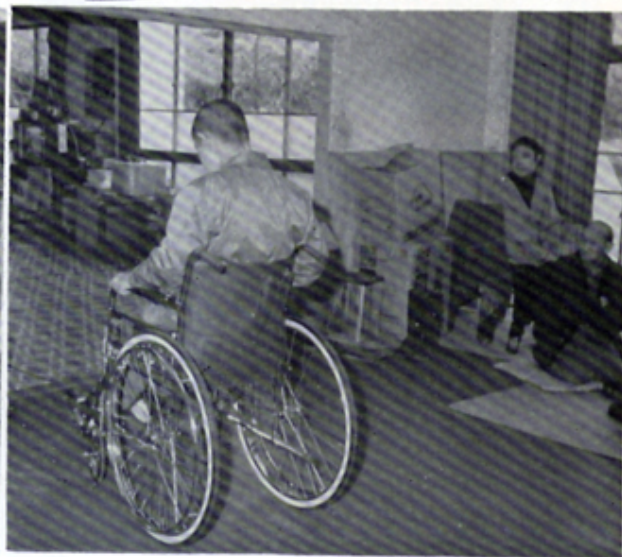
市救護所へ車椅子を寄贈