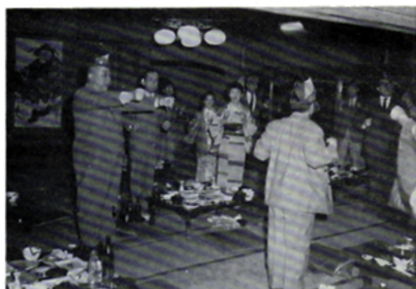
ではこのへんでお開き