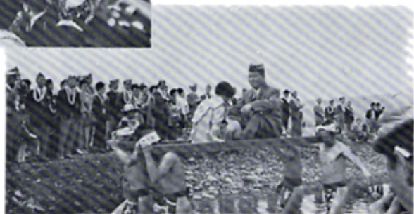
運台渡し 深い川を渡るし、瀬上