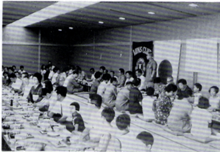
納涼家族会 於日通富士見ランド