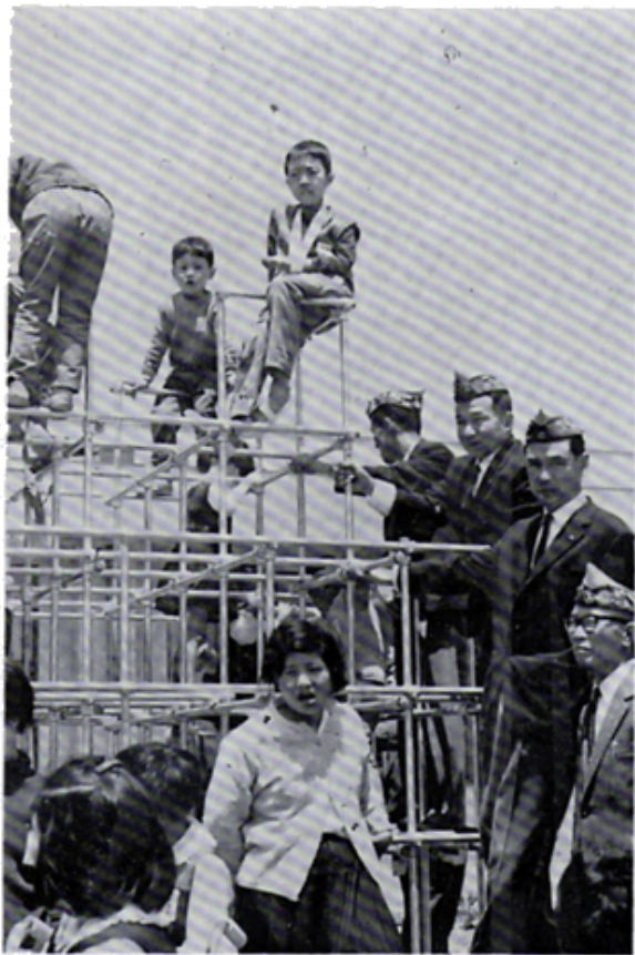
ジャングルジムとハーフボールを 伊豆療護園へ寄贈