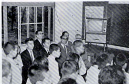
金岡中学特殊学級へテレビを寄贈