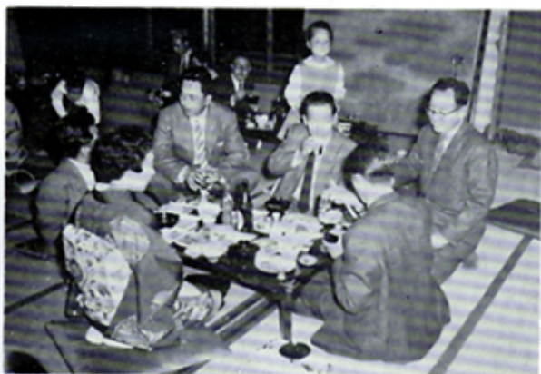
家族同伴じゃーあんまり飲めないねー