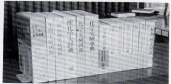
市立駿河図書館へ図鑑を寄贈