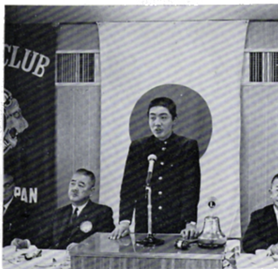
岩本君のスピーチ