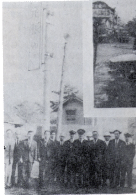
箱根の道路状況を報知する ネオン標示灯を寄贈 (西間門交又点)