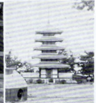
香貫山平和塔へ鉄さく寄贈