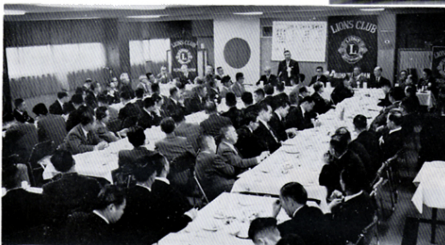
三輪ガバナー公式訪問