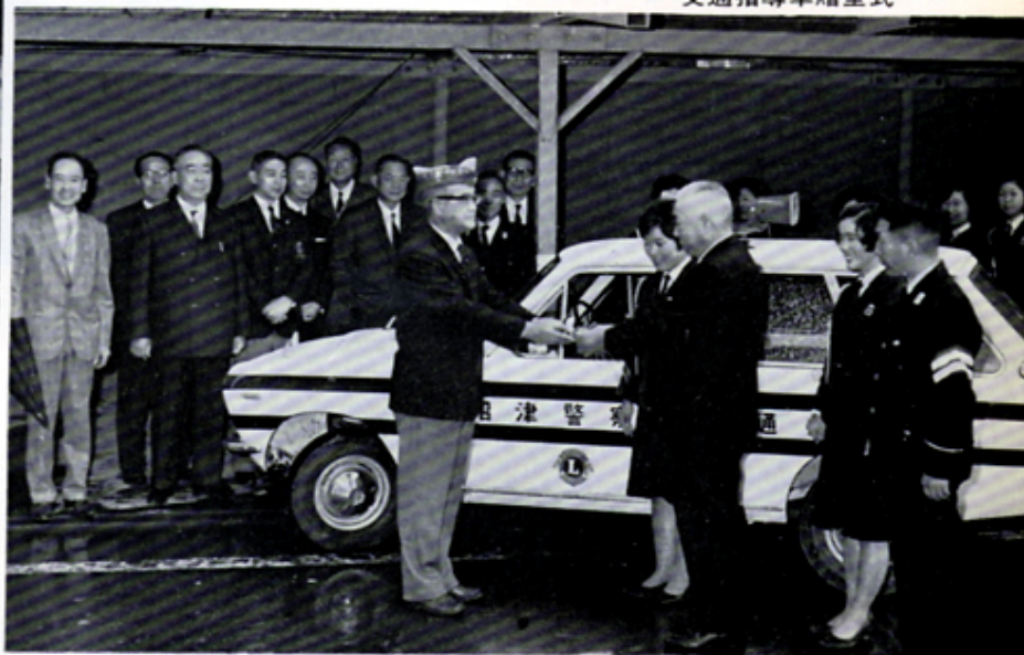
交通指導車贈呈式