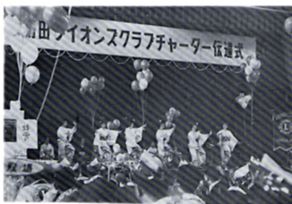
島田Cのチャーターナイト