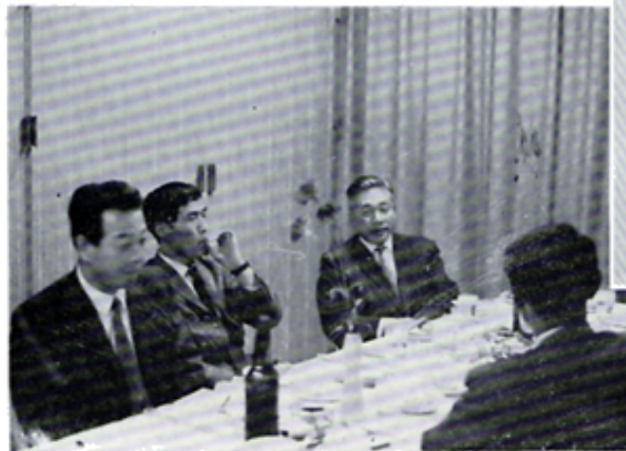
「小さな親切運動」につき報道関係者と懇談