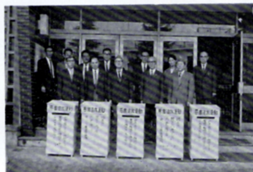
市内要所へ悪書追放箱設置