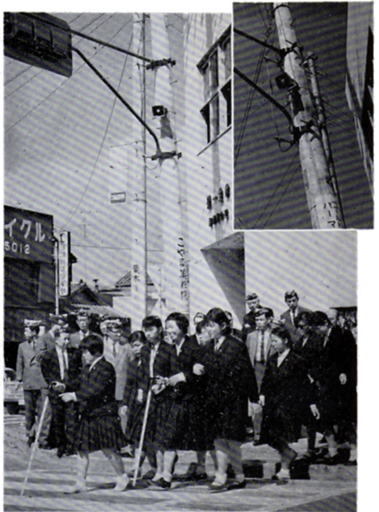
盲人誘導音響装置を盲学校南の通学路へ設置