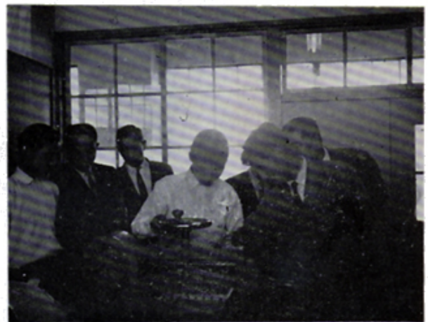
金中特殊学級へ印刷用裁断機