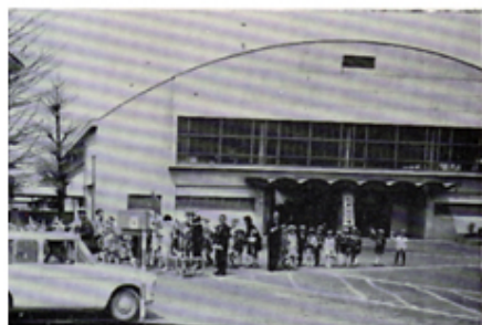
贈呈した教材による交通教室