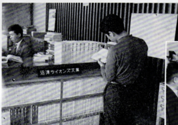
市立駿河図書館へライオンズ文庫を寄贈