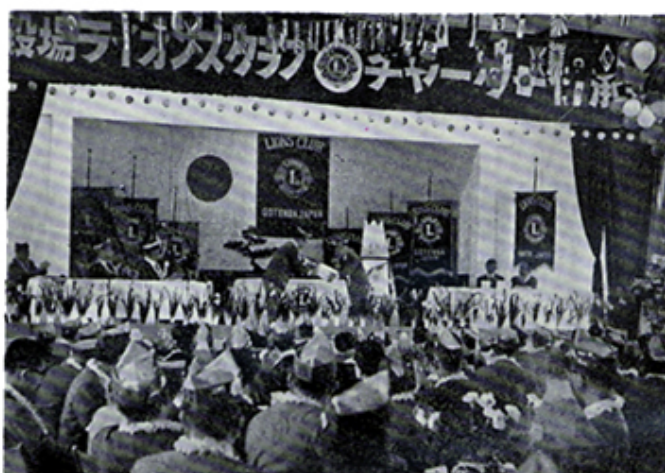
御殿場クラブチャーターナイト