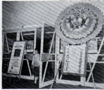
チャリティショー 劇団たんぼぼの公演を主催 於公会堂