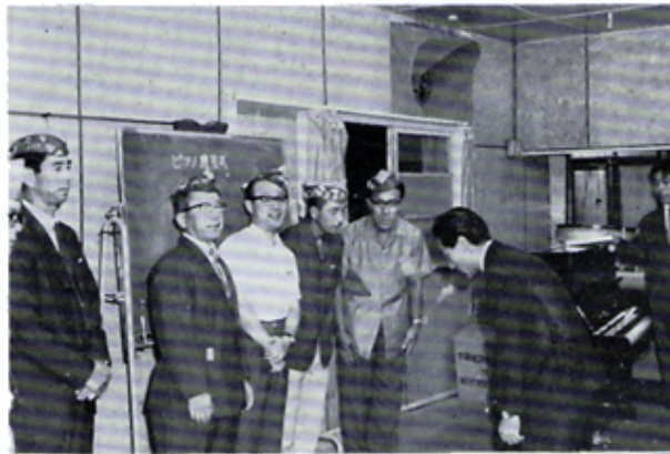
青少年合唱団へピアノ贈呈