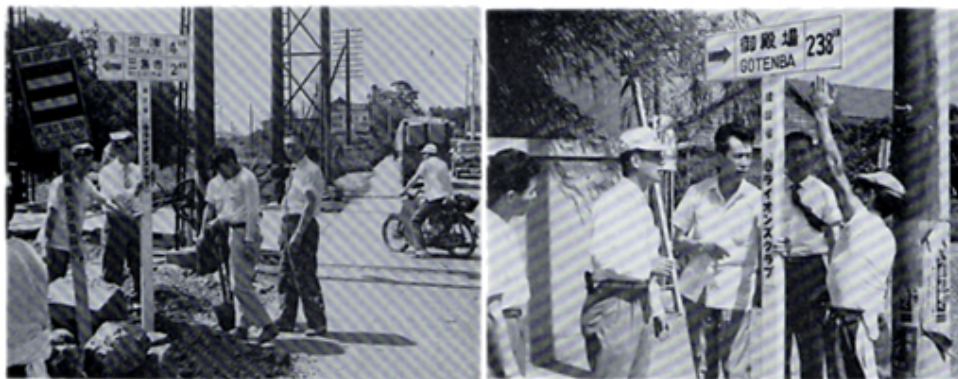
年度スローガンに基き道路標識を設置