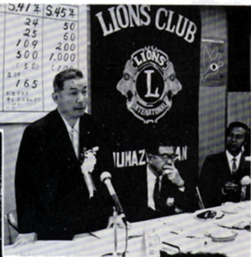
三輪ガバナーのスピーチ