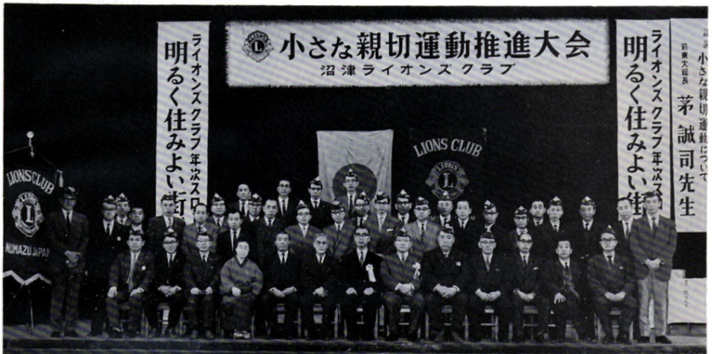
「小さな親切運動」大講演会 記念撮影 於公会堂