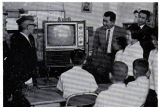
第1中学特殊学級へテレビ