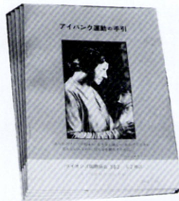
「アイバンク運動の手引」を発行