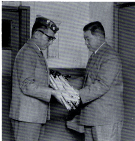
三須沼津盲学校長へ白杖贈呈

聴力検査機を寄贈 耳の日に 盲学校へライオンズ俱が きよう三日は耳の日、この日を記念し、日沼津ライオンズ・クラブは、盲学校に聴力検査機を贈るといい、市社会福祉協 北にある沼津市聴力検査機 ター、一基(