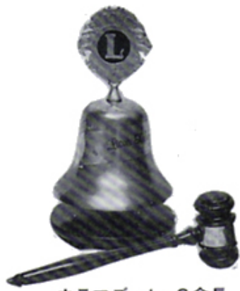
カラマズーL.C会長より贈られた槌