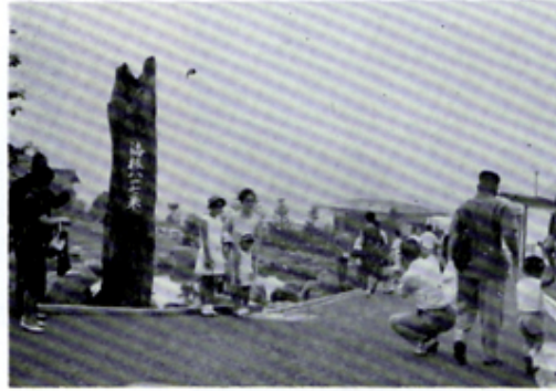
納涼家族会 於朝霧グリーンパーク