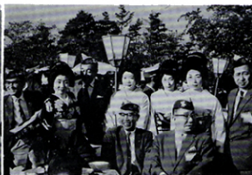
きれいところに囲まれて……