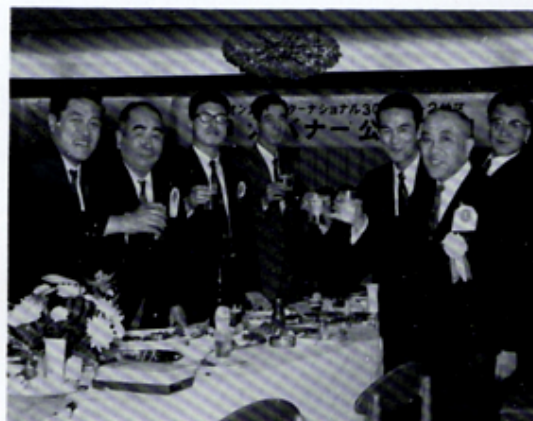
今井ガバナーの公式訪問