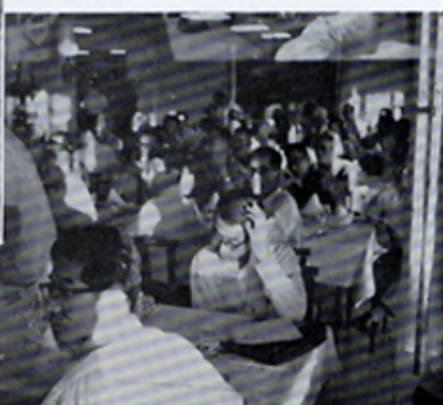
カクテルの作り方を学ぶ