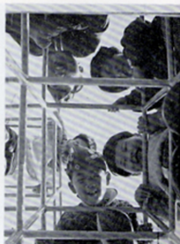
伊豆療護園へジャングルジム