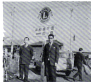
結成記念に国道六ヶ所へ道路標識を建設