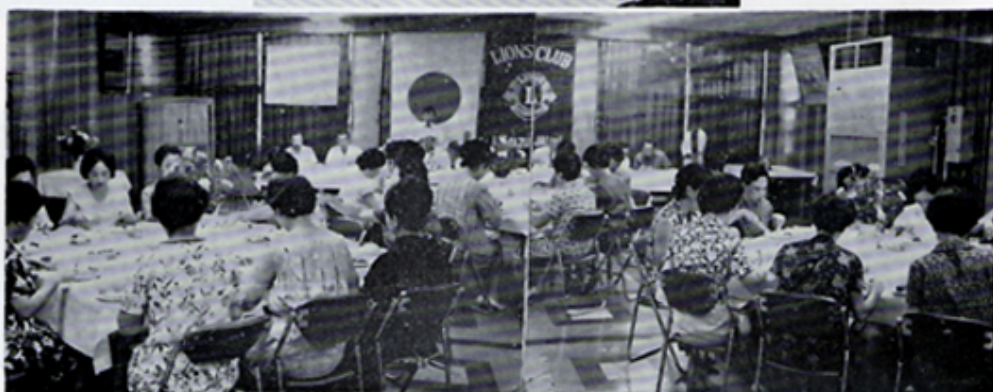
第1回ライオネスの会