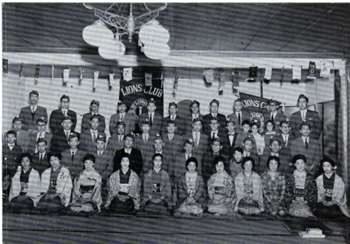
C. N. 1周年記念 於千松閣