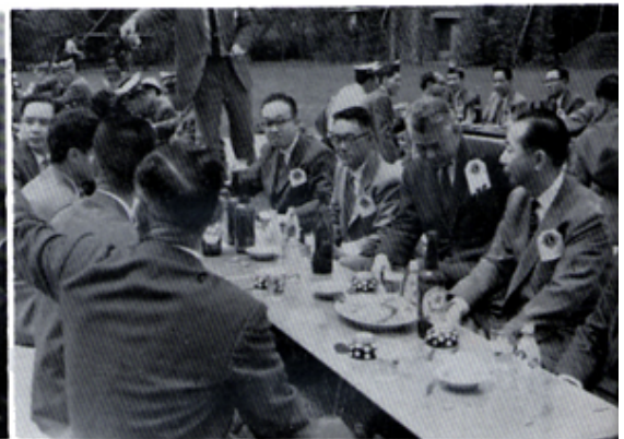
御殿場Cとの合同例会