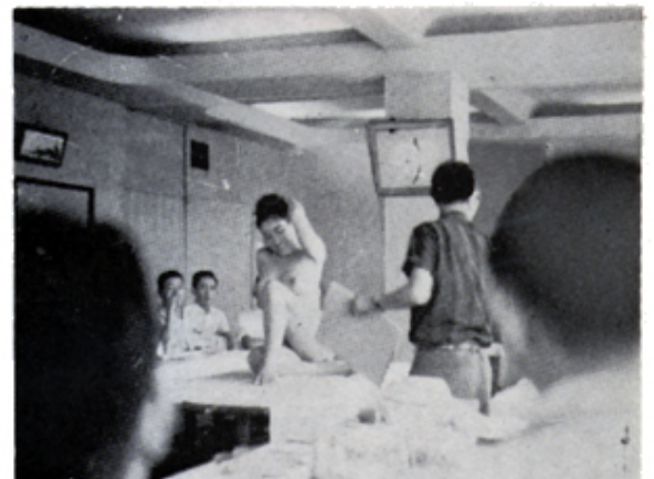
ゲストスピーカー日展審査員 和田金剛氏