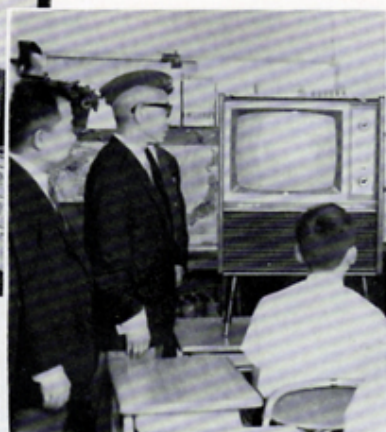
伊豆療護園へテレビ寄贈