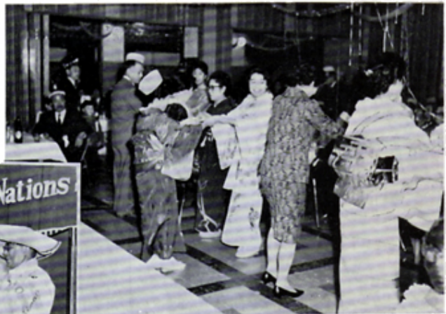
X'マスに於ける ライオネスのダンス