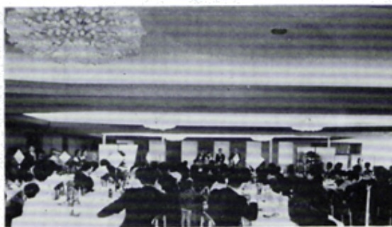
例会場桃中軒会館新装なってオープン