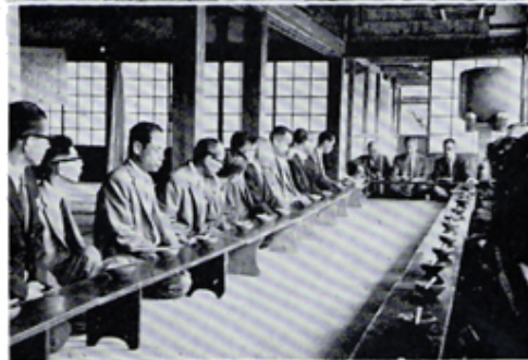
電沢寺に於ける修養例会