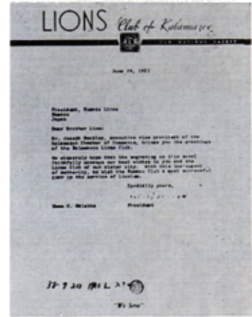
カラマズーL.Cマロット会長からの手紙