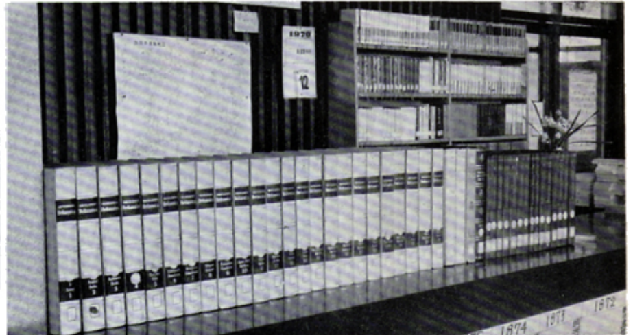
エンサイクロペディア・ブリタニカを駿河図書館へ寄贈