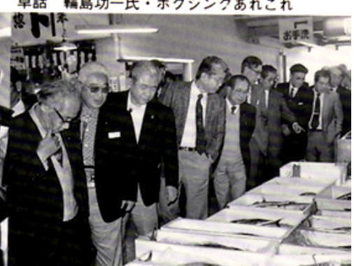
サカナセンター見学