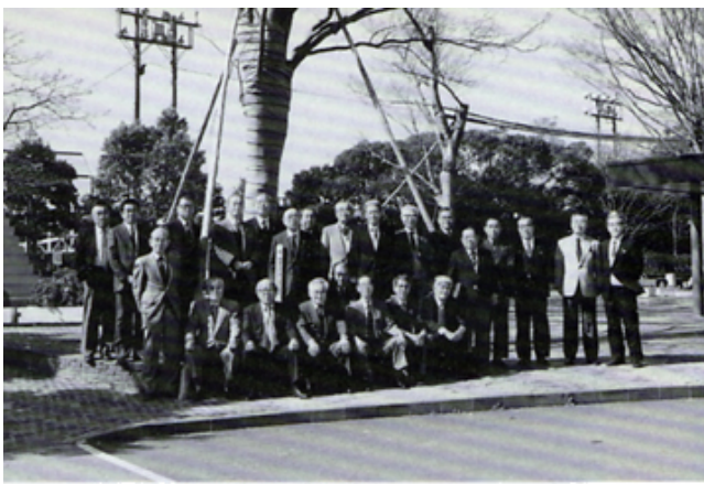
沼津市民文化センター植樹