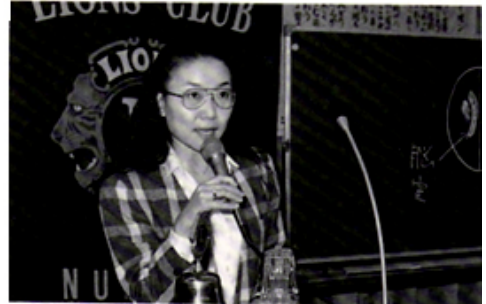
卓話 古屋女史・健康について