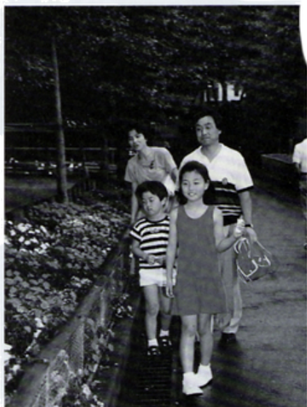
L 小池のファミリー・まかいの牧場