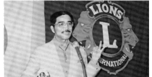
卓話 内田氏・外食のイロハ