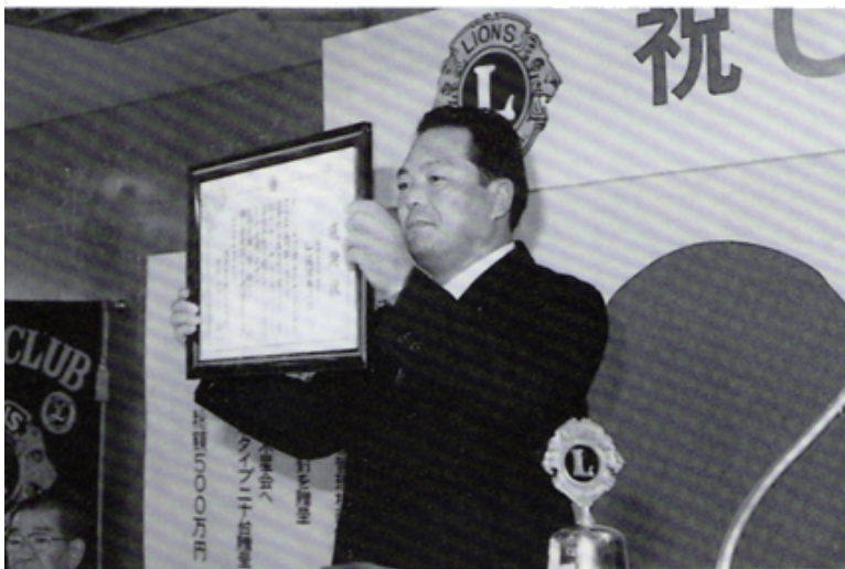
少年自然の家管理棟改修工事担当のL飯田表彰