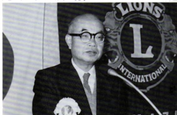
卓話 大山永世名人・将棋と人生