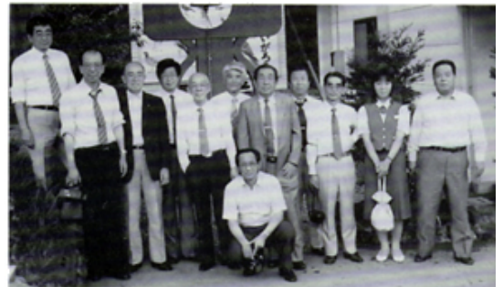
複合地区大会・養老にて