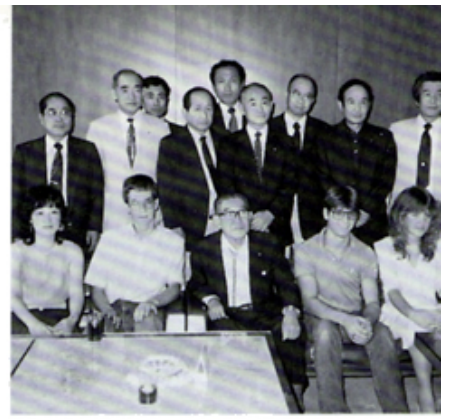
Y E 生と市長訪問