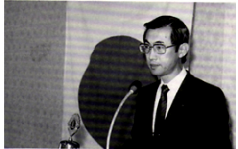
卓話 井野博士・地震の話