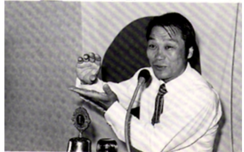
卓話 輪島功一氏・ボクシングあれこれ