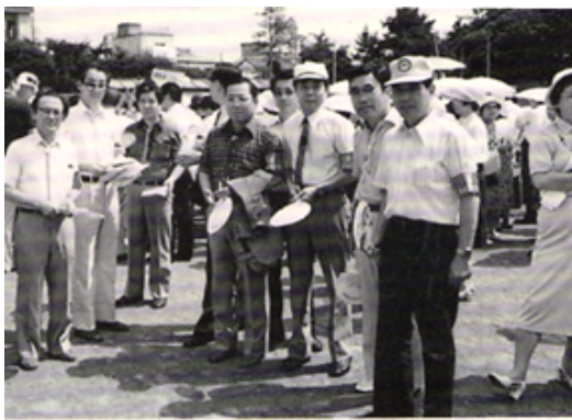
非行防止キャンペーンへ参加