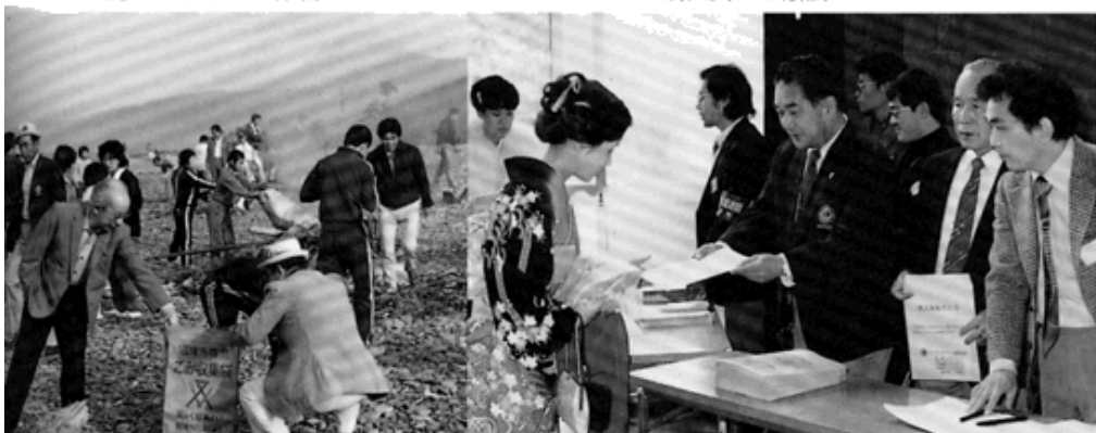
成人式にて献眼のPR