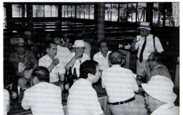
まかいの牧場で昼食