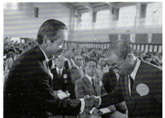
地区年次大会にて会報コンテスト優秀賞に輝くL杉本