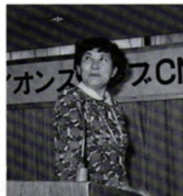
卓話のドクトルチエコ女史