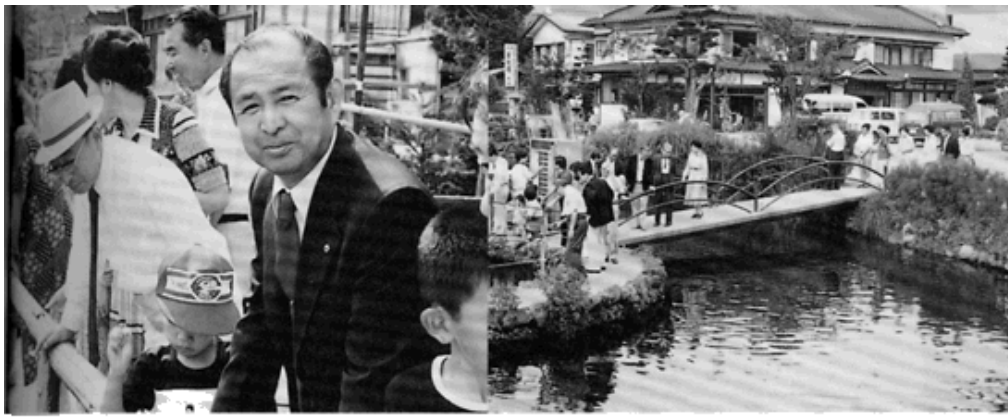
湧水池はあくまでも深く