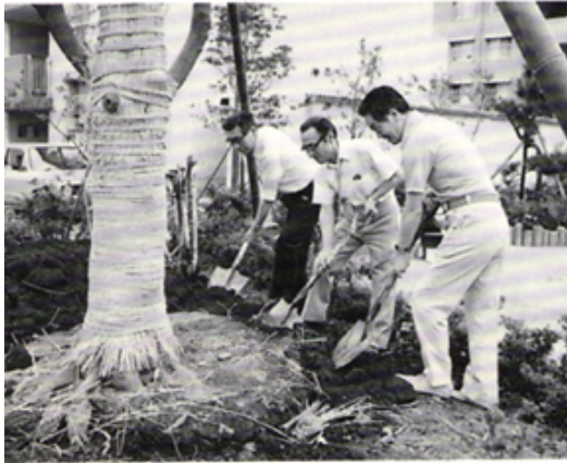
蛇松緑道への植樹