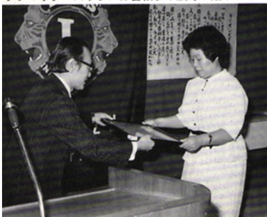
駿河療養所小国婦長さんを表彰