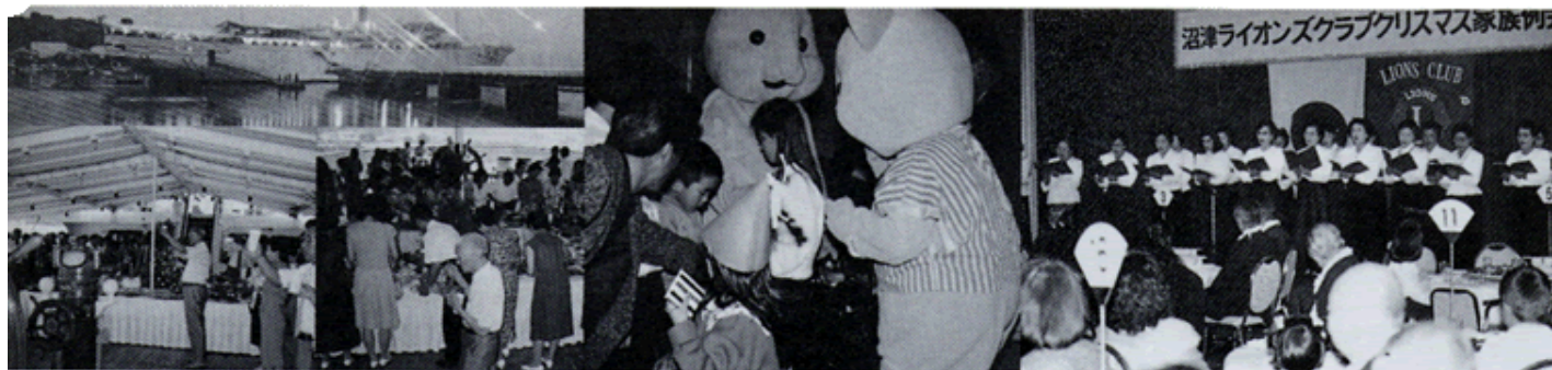
内涼例会 三津スカンジナビア号にて