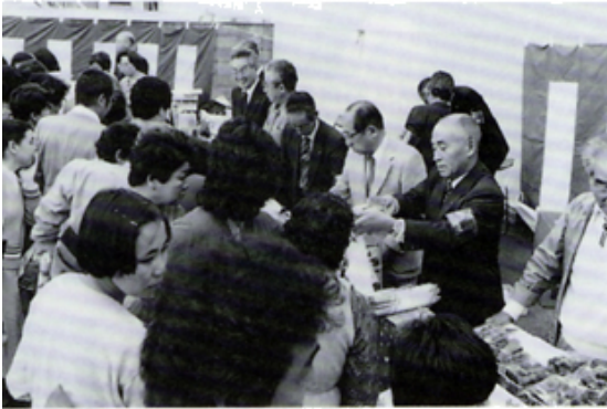
恒例バザー・売れに売れて