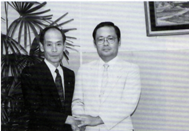
初の親子ライオン L. 大古田