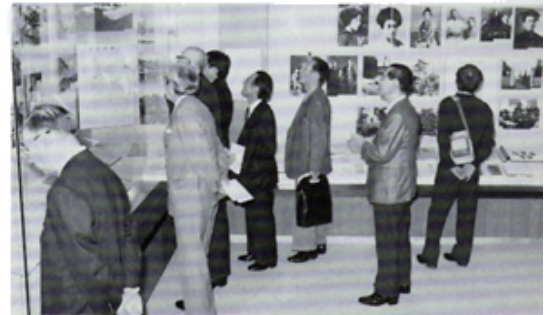
若山牧水展示室にて