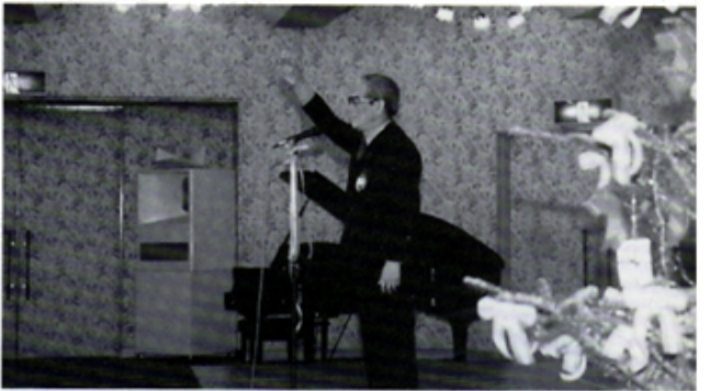
第一副会長L久松の意気高し・ウイ・サーブ