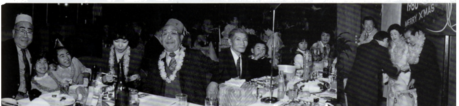
クリスマス例会でのメンバー・家族の四景