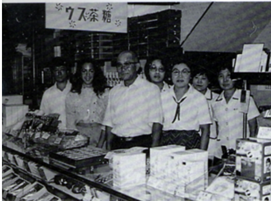
Y E 生水口園訪問