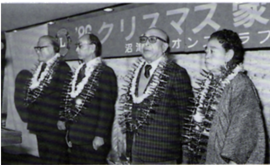
金婚式おめでとう