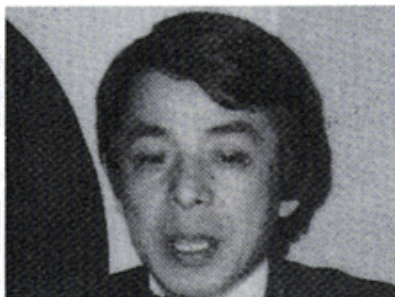
石津祥介氏 男のおしゃれ