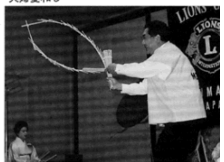
極めつき南京玉すだれ