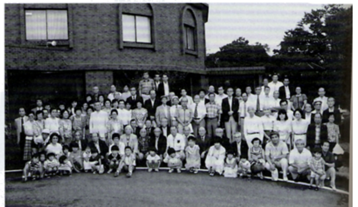
富士宮グランドホテル前庭にて