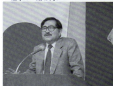
久保氏・読書と人生