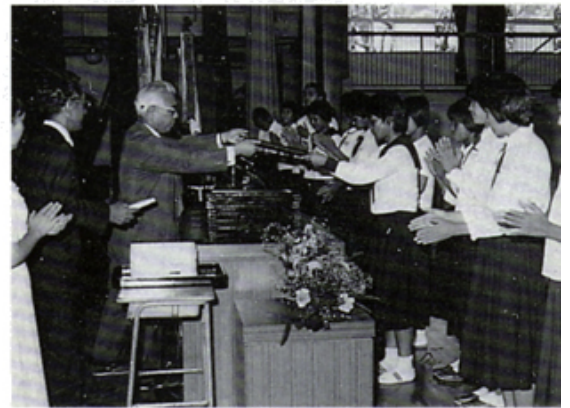
少年の主張沼津大会