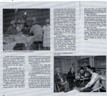
ライオン誌外国版に掲載される