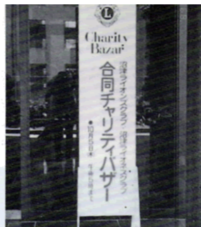
合同チャリティバザー会場入口