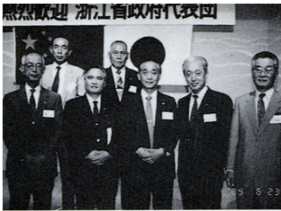
浙江省政府代表团と共に