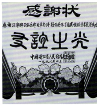
浙江省よりの感謝状