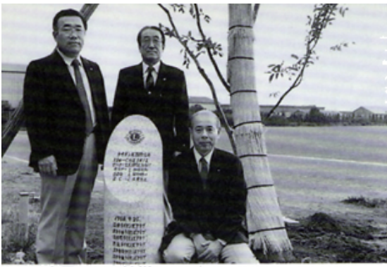
合同A T C 植樹