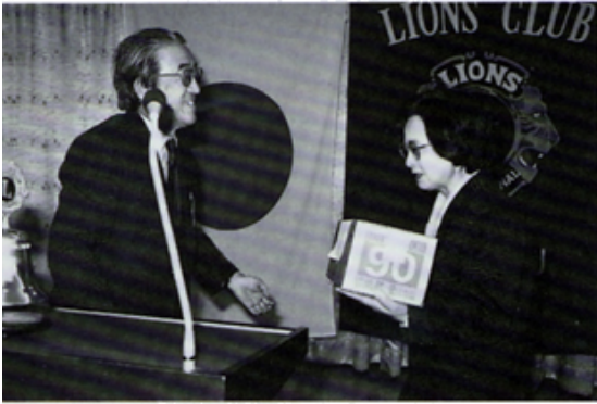
「かたつむり」点字グループへ助成