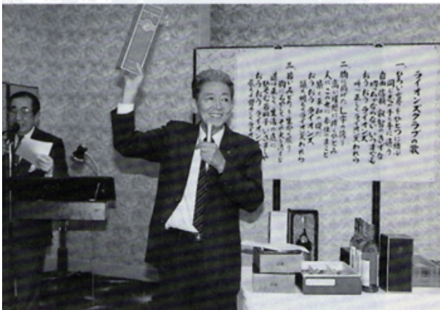
L 石川のオークション