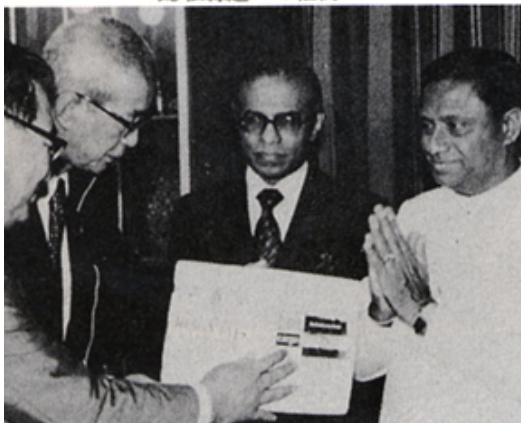
ブレマサダ・スリランカ首相より眼鏡が贈られる