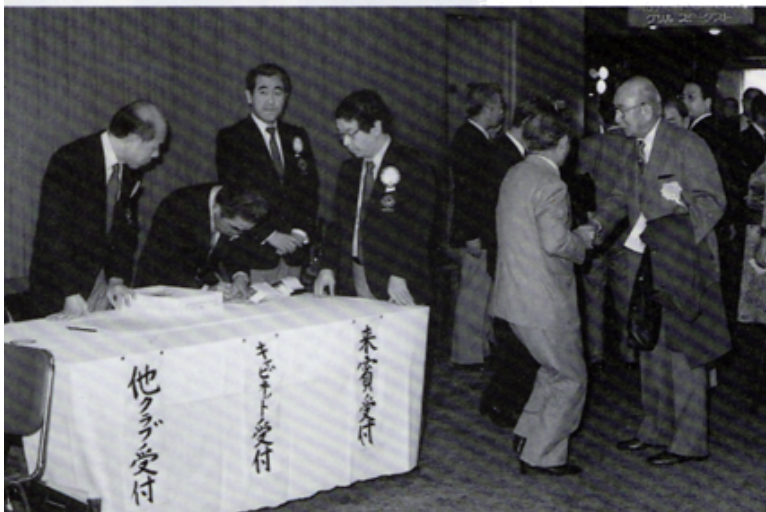
C N 25周年式典の受付風景