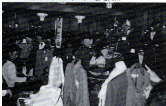
デパートの雰囲気そのままのバザー会場