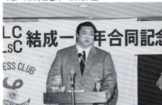
卓話 北の湖・苦しかった修業時代