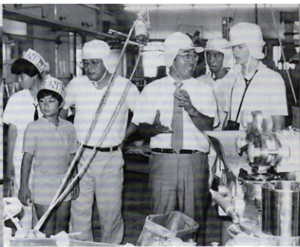
Y E ・ヌマヅベーカリー見学