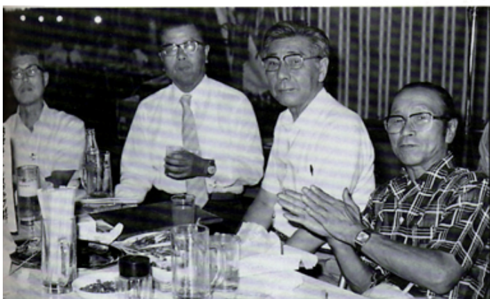
納涼例会 ①酔うほどに