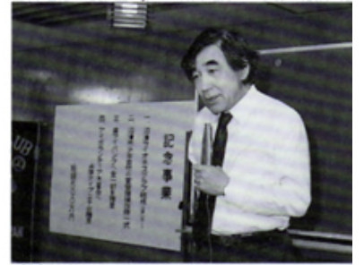
佐沢氏・新聞の表と裏