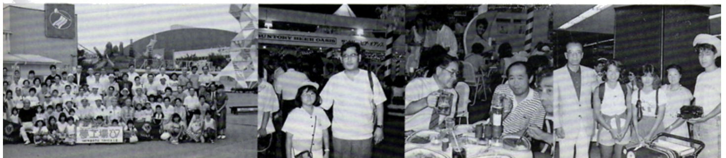
納涼例会 夢工場 '87にて