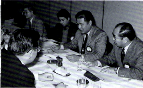
最後のつめを入念に