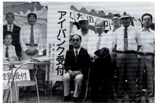
アイバンクPRもー役