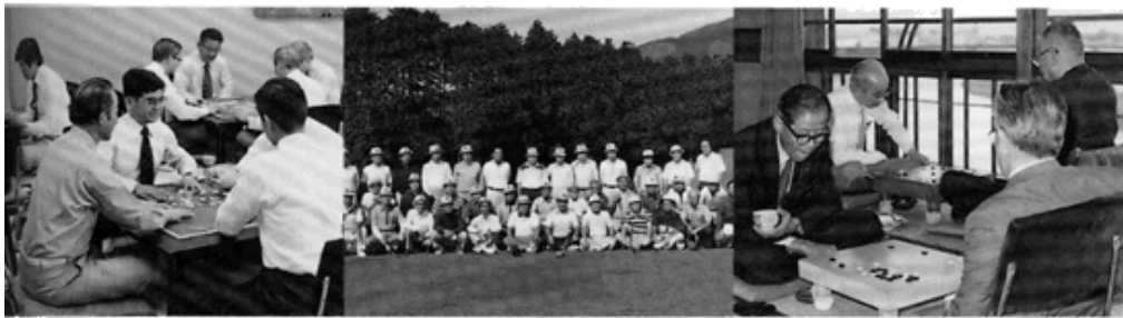
倉敷と麻雀で和を結ぶ