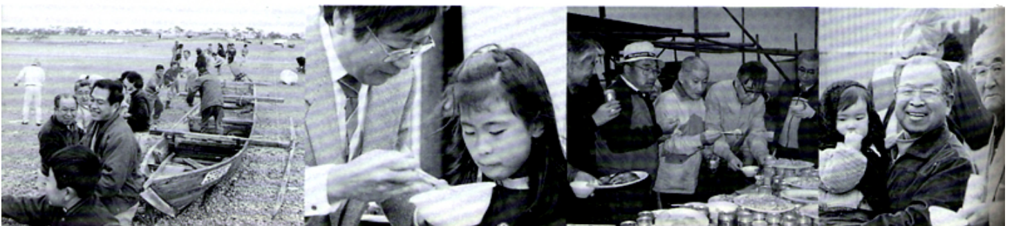
早朝例会 原海岸にて綱引き四景