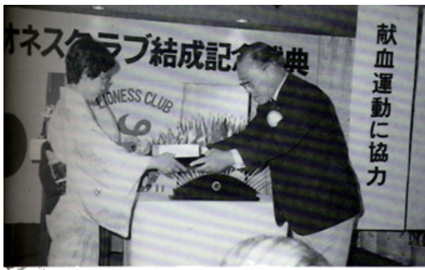
滋賀ライオネスクラブ誕生