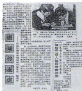
浙江省での報道記事