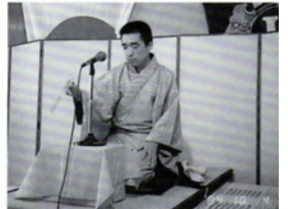
三遊亭の一席お伺い