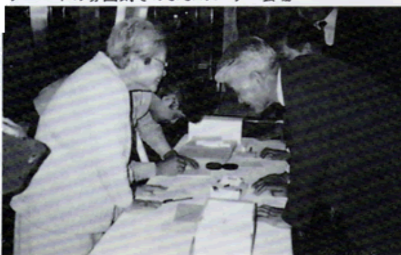
来場者に献眼登録を呼びかける