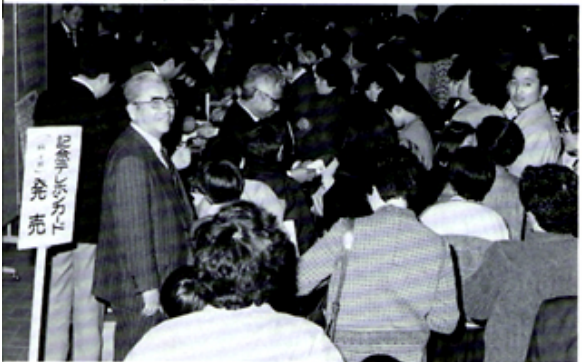
千客万来うれしい悲鳴