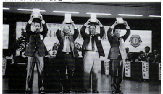
地区年次大会でACT銀賞受賞