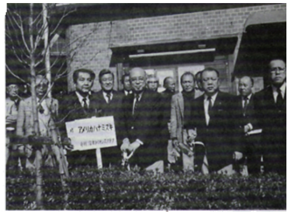
大手町交差点へアメリカハナミズキ植樹