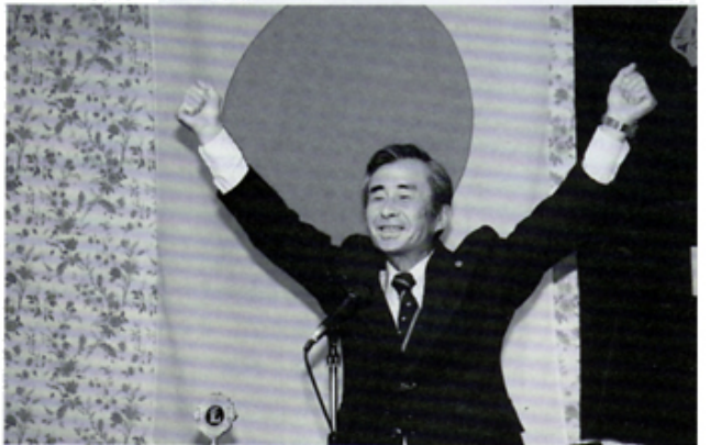
内規改正記念ローL山上