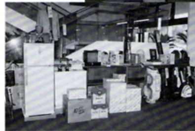
チャリティゴルフ大会