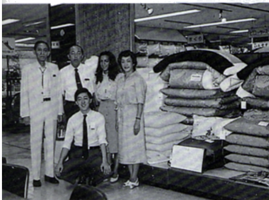
Y E 生わたやす訪問