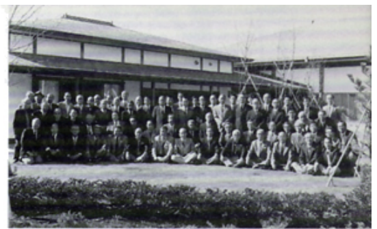
移動例会・牧水記念館