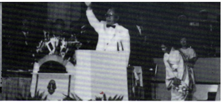
高村ガバナー誕生