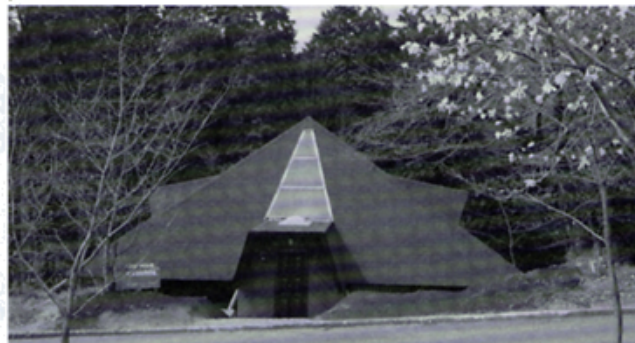
改修された少年自然の家管理棟