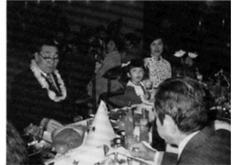
レイをかけるのも家族のため