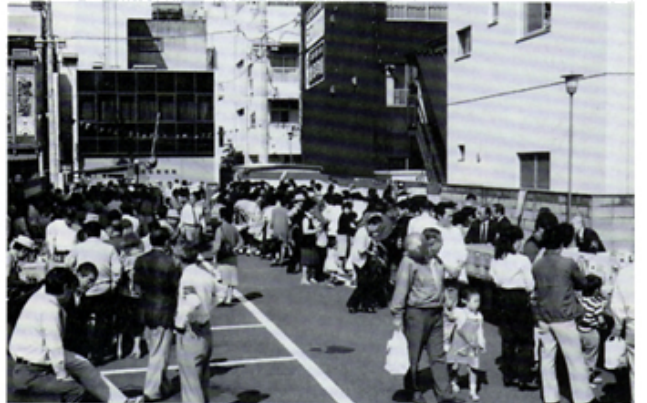
開会を待つバザー会場