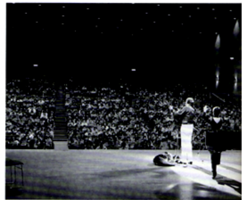
満席の聴衆と和して