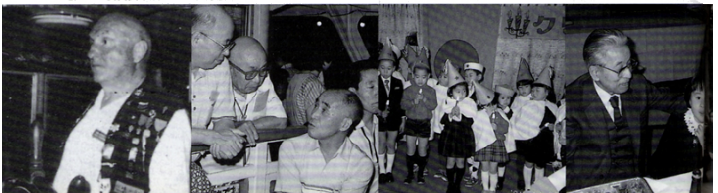
おじいちゃんはやさしい