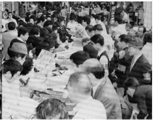
仲見世バザーは大盛況