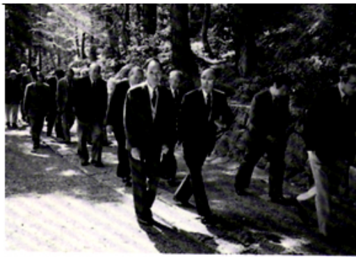
三島・龍沢寺の参道にて