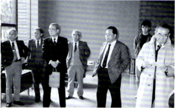
ホールで来場者を待つ