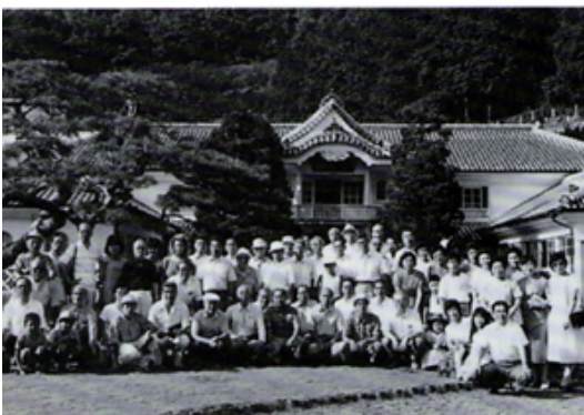
松崎岩科小学校前にて