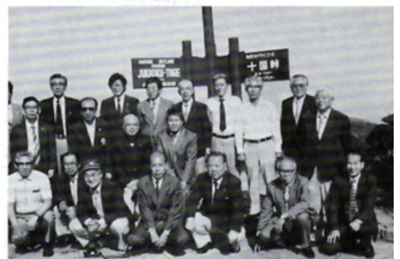
見学例会の帰路十国峠にて