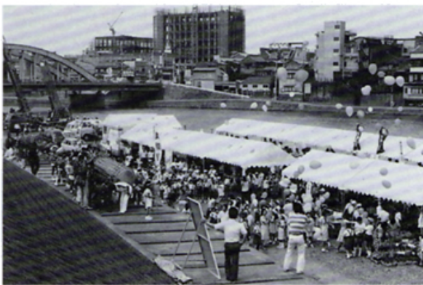
五月の空に鯉のぼりフェスティバル