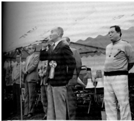
砂の造形大会でL河内挨拶