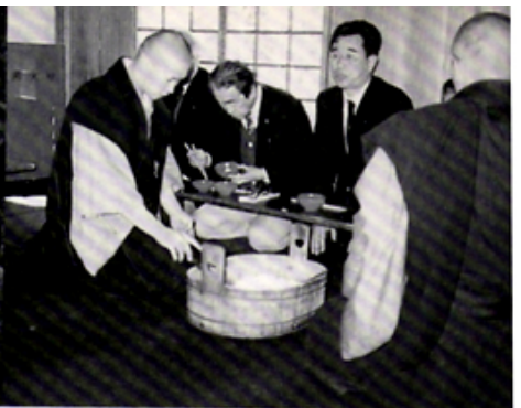
龍沢寺にてご相伴