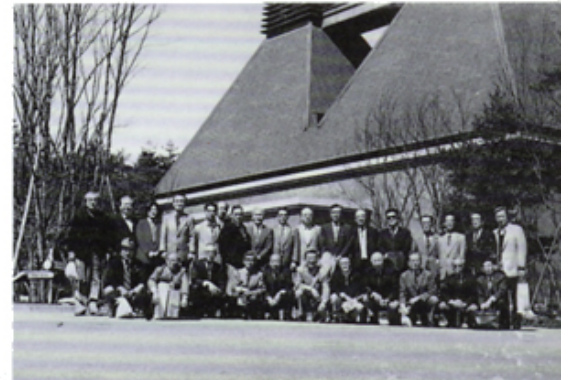
サントリーウイスキー博物館にて