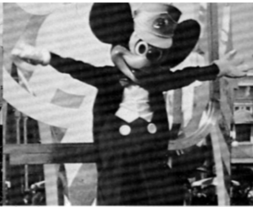
ディズニーランド・ミッキーマウスに對面