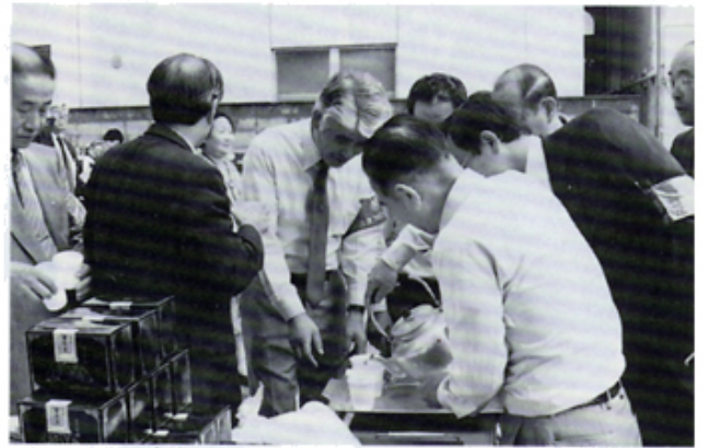
チャリティバザーでの品揃へ