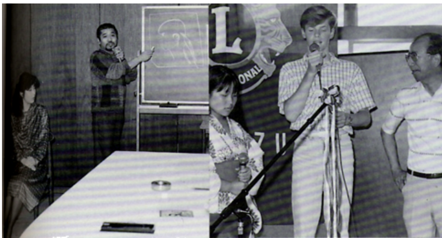
芸術例会・デッサンの基本