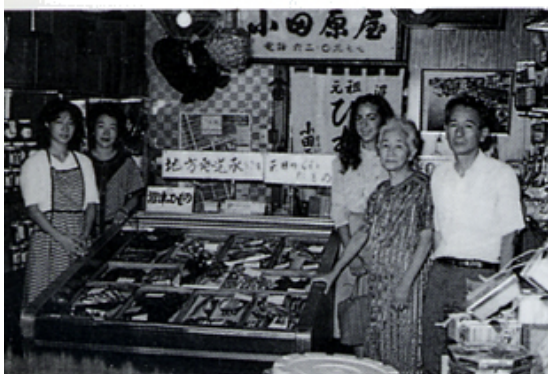
Y E 生小田原屋訪問