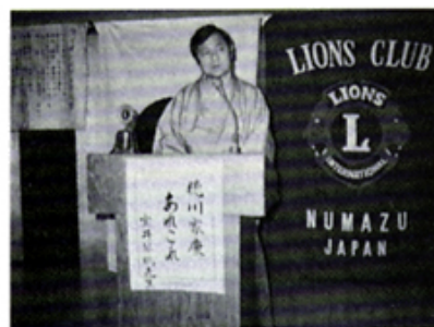
宝井琴鶴師 徳川家康あれこれ