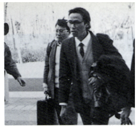
無事開眼退院の二人の患者さん