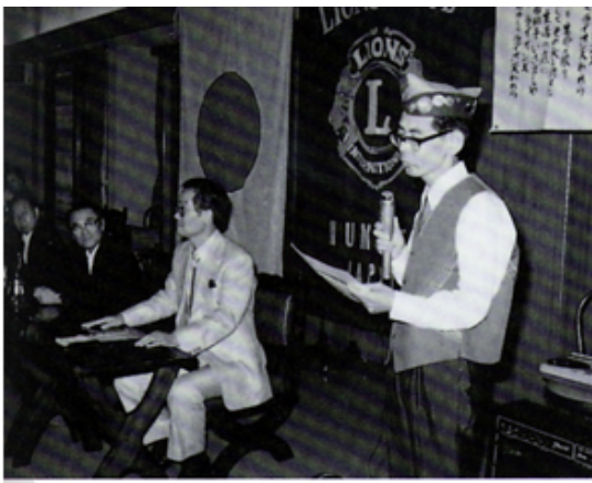
ツイスターで活躍のL保坂