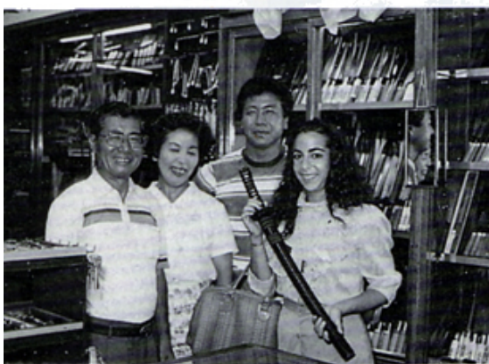
Y E 生正秀訪問