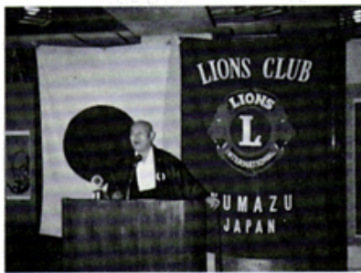
松蔭寺中島住職 白陰について