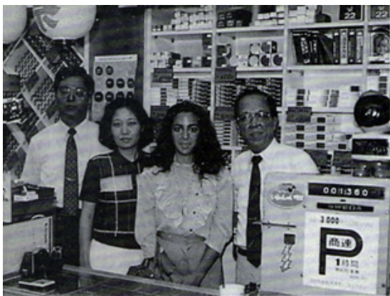
Y E 生中村カメラ店訪問