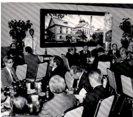
サッポロビール焼津工場