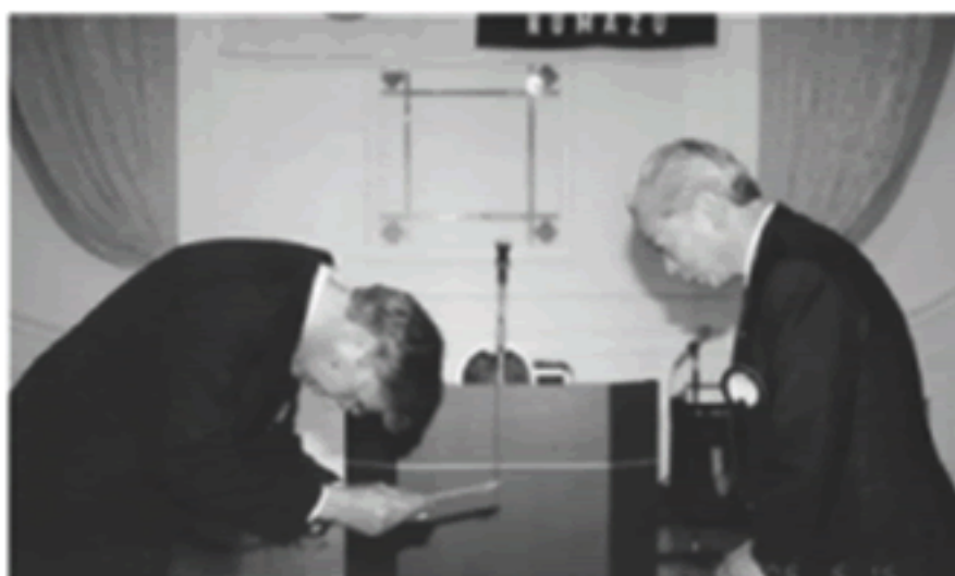
L.赤堀より 寄付金の贈呈