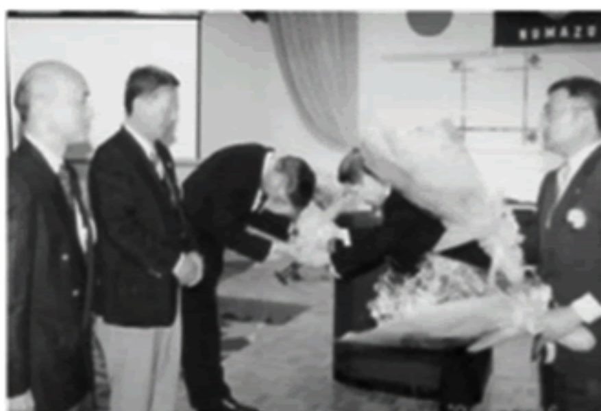
旧三役に花束贈呈