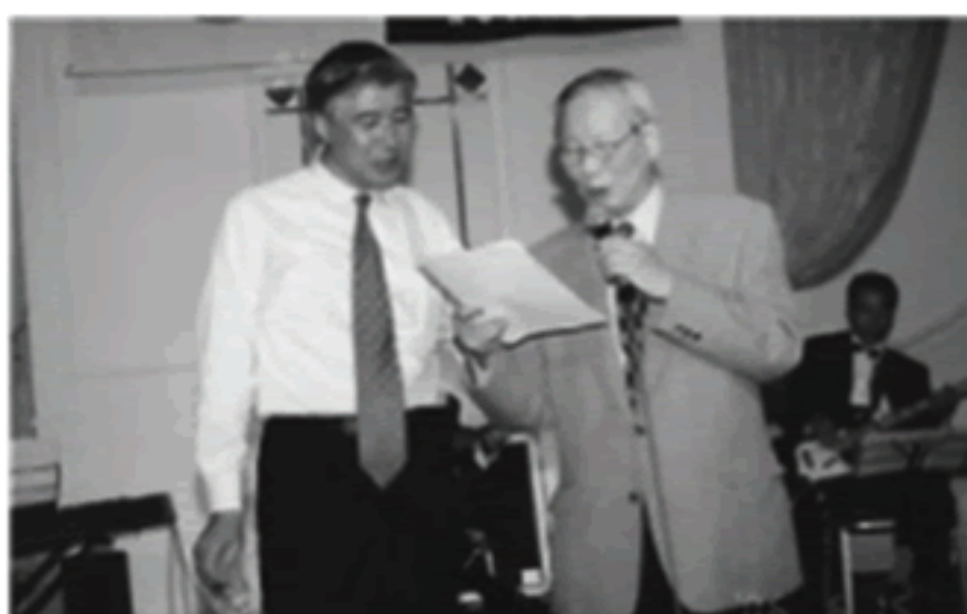
カラオケタイムへ