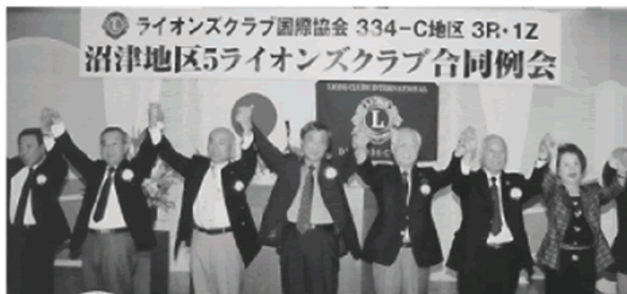
「また逢う日まで」斉唱