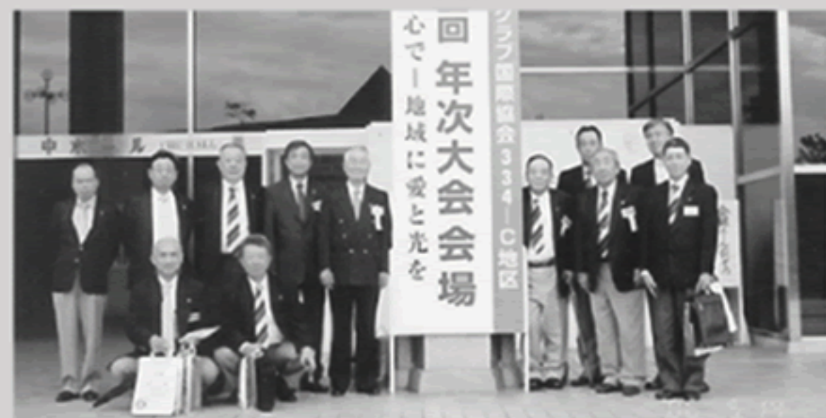
出席したメンバー