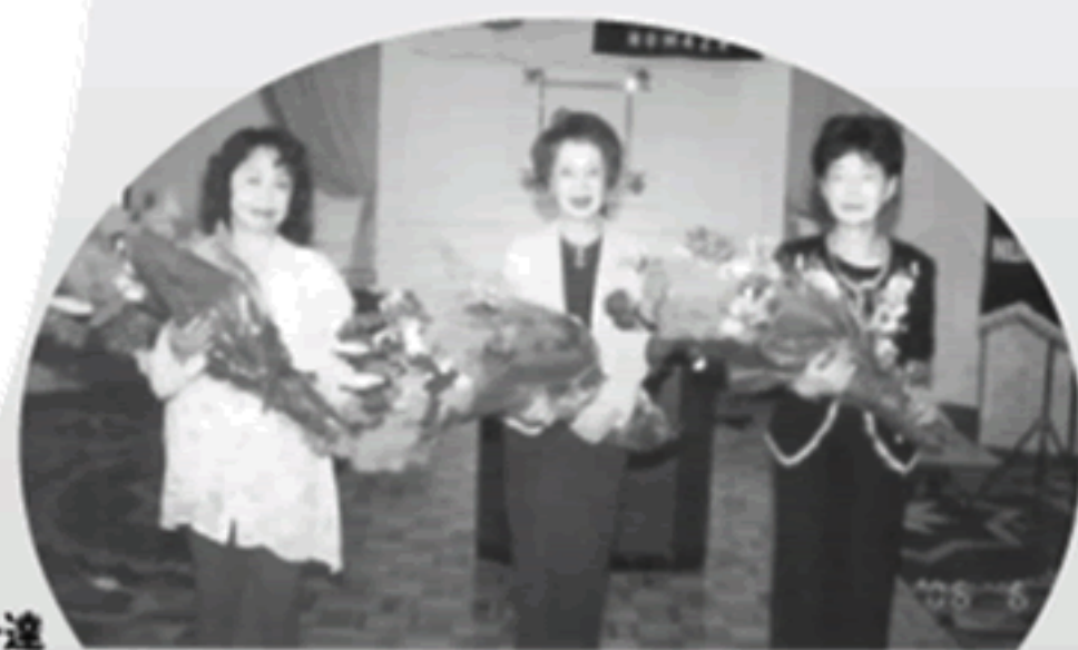
ライオネス3役のメンバー達