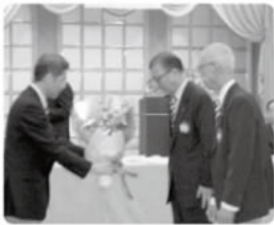
チャーターメンバー 2名に花束贈呈