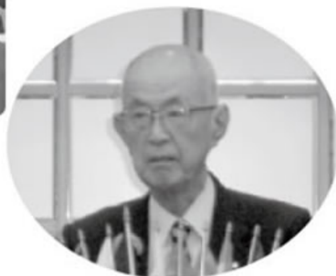
臓器移植対策推進功労者厚生労働 感謝状受取挨拶L.勸山