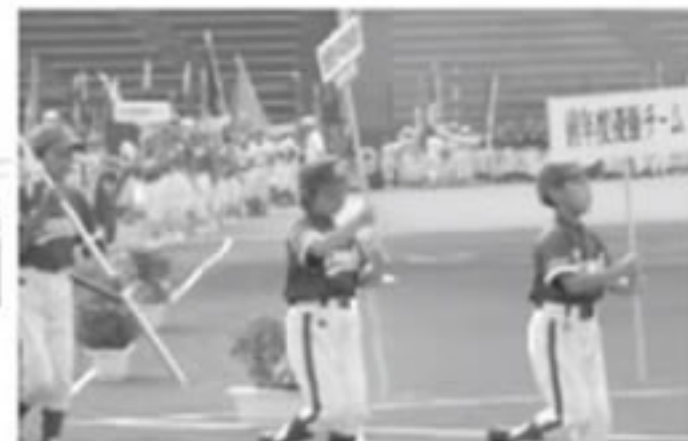
出場各チームの入場行進