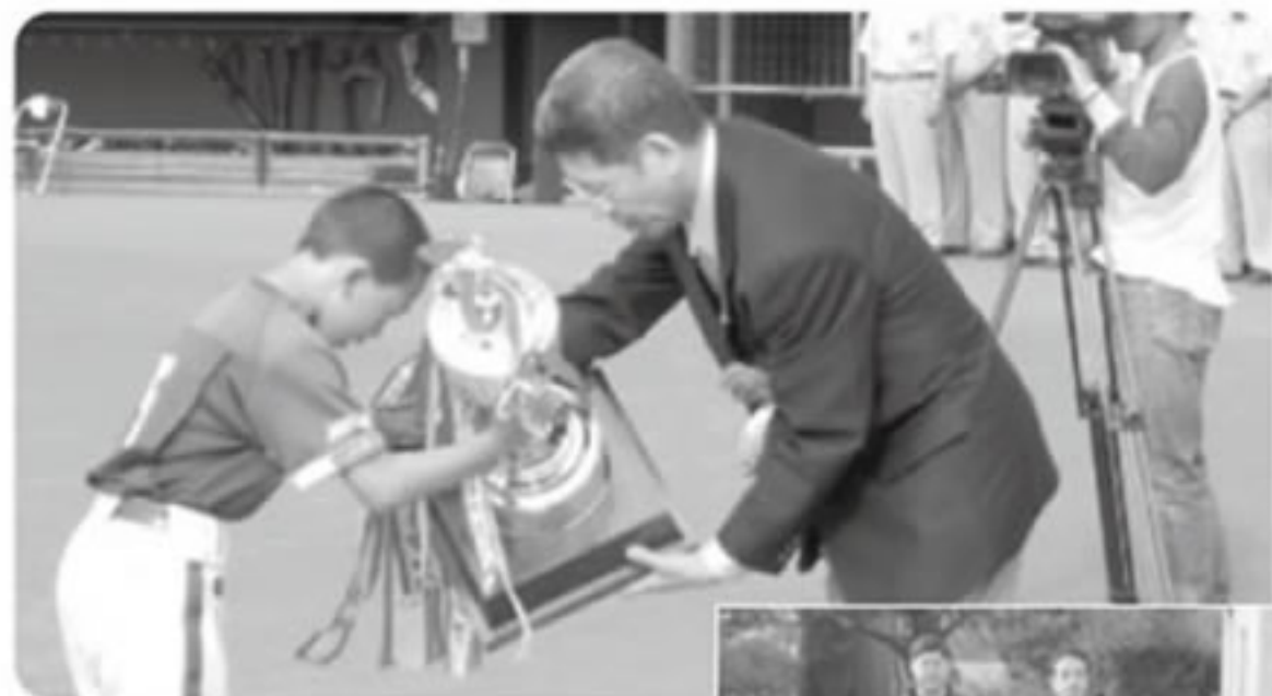
ライオンズ杯返還