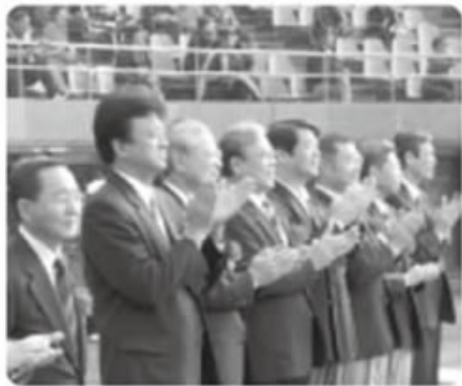
入場行進を見守る来賓と各ライオン