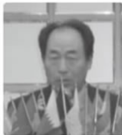
富士宮ライオンズクラブL.芹澤会長より来賓代表挨拶