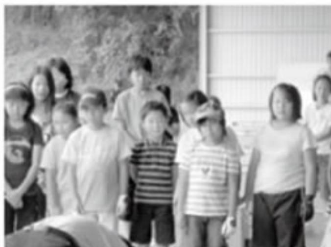
参加してくれた子供たち