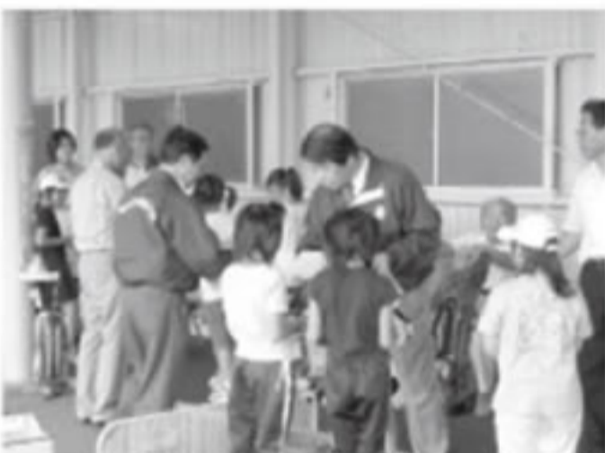
子供たちに修了証を渡しました