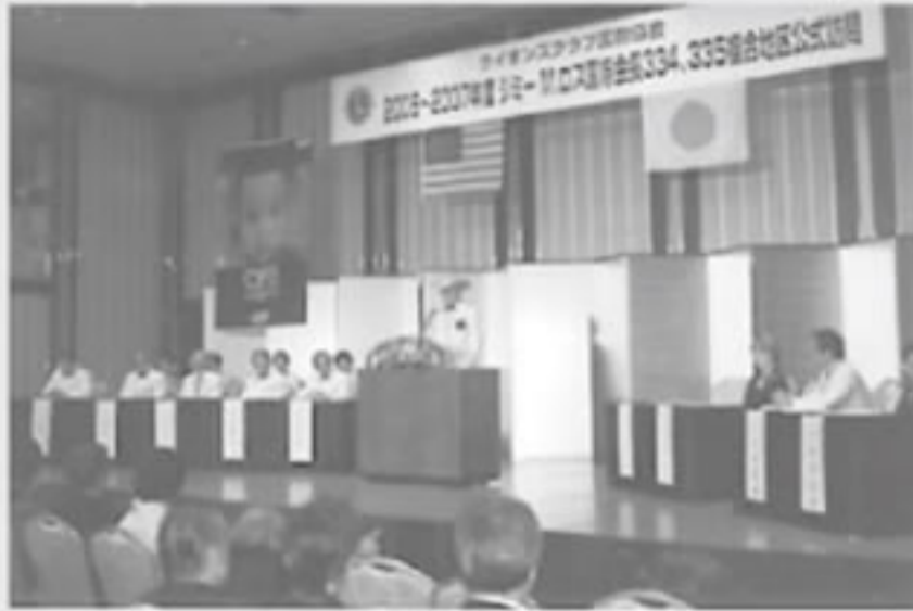
公式訪問会場風景