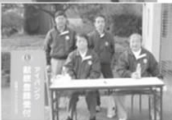
あしたか球場にて献眼登録受付