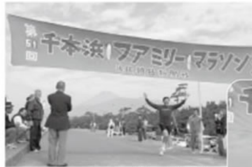
ファミリーマラソン大会