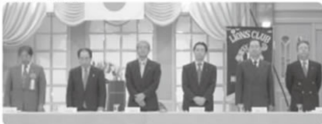
富士宮ライオンズクラブの皆様