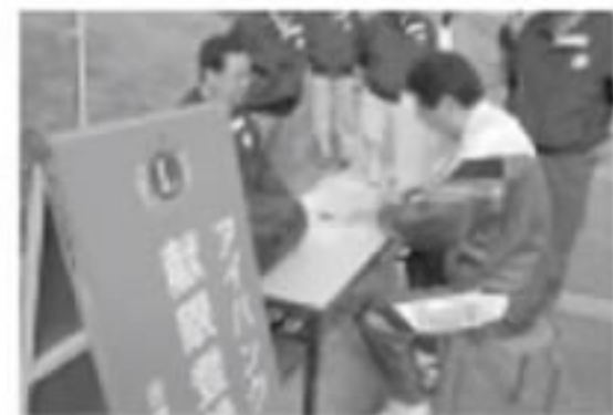
千本浜会場にて登録受付業務