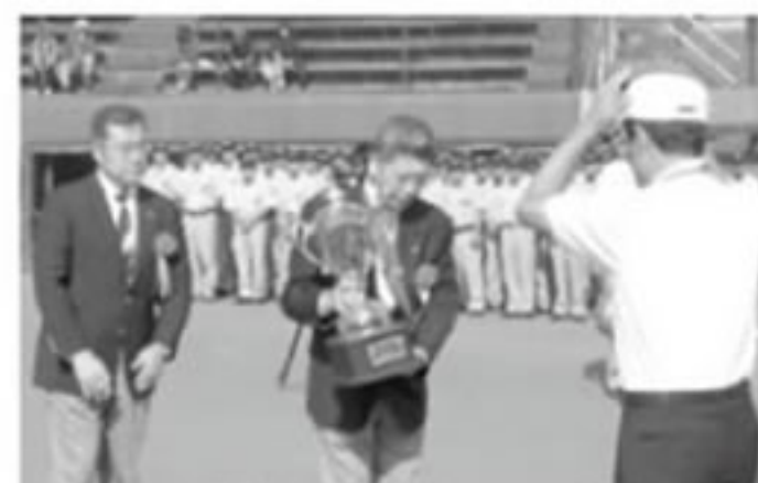
本年度よりライオンズ杯を新しくしました