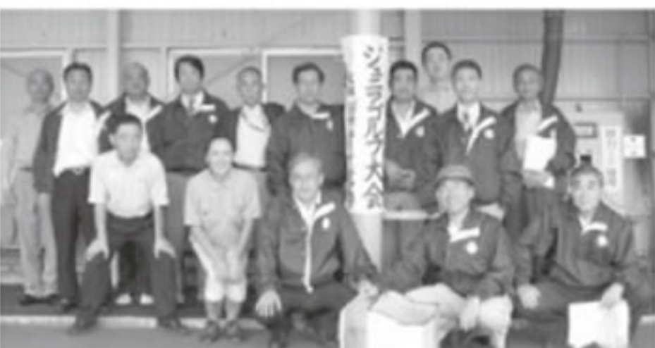
参加したライオン