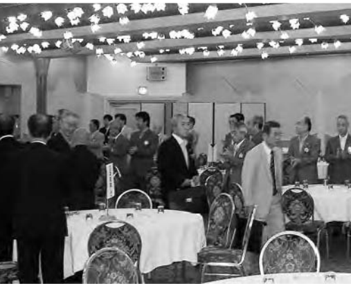
地区ガバナー、地区役員入場