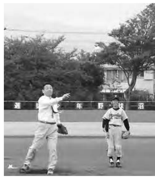
小池会長始球式です