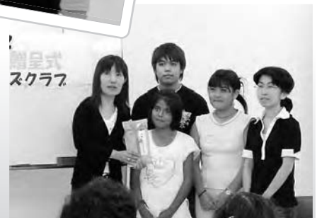
「地球のステージ2」チケット寄付