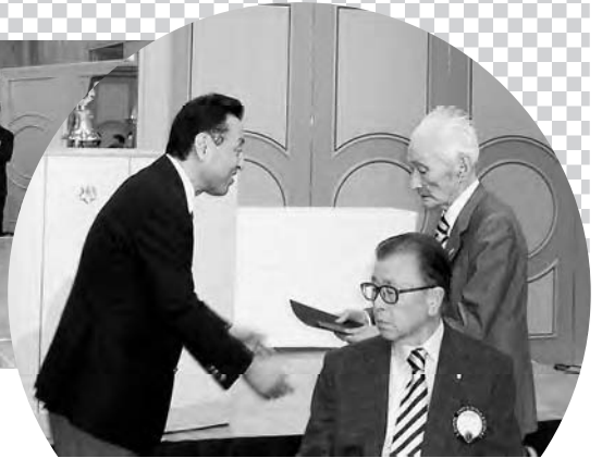
終身会員証伝達 L.赤井