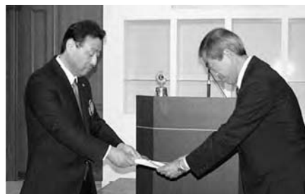
沼津市社会福祉協議会様に贈呈

10月18日(木)、PR情報委員会担当の第2例会が実施されました。沼津市社会福祉協議会へ助成品目録の贈呈が行われました。