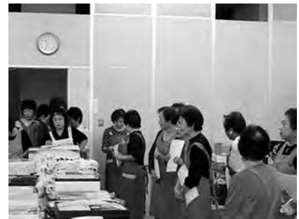
後援は沼津ライオネスクラブの皆様