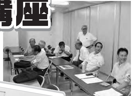
準備中のメンバー

9月8日(土)、15日(土)パレット3Fにおいて行われたデジカメラ講座は8月22日には満席になるといううれしい反応で、当日は熱心に講師を見つめる多くの熱気がありました。