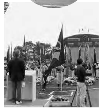
野球少年はいいですね