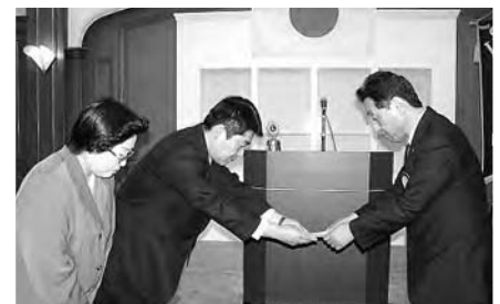
落合ライオンのご家族よりアイバンク運動へ寄付