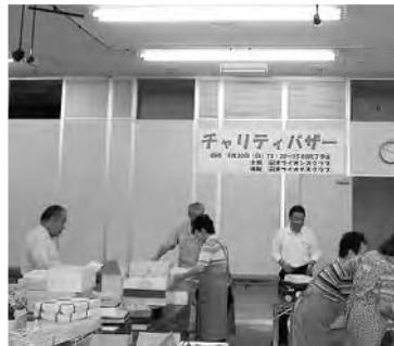
定刻前から準備が始まります

9月30日(日)沼津駅前南口に於いてチャリティバザー、献眼登録が行われた。あいにくの雨天ではあったが、多数の皆様参加を頂き50万円を超える売上げを果たせました。併行して行われた献眼登録受付も15名。実りのあるアクティビティでした。