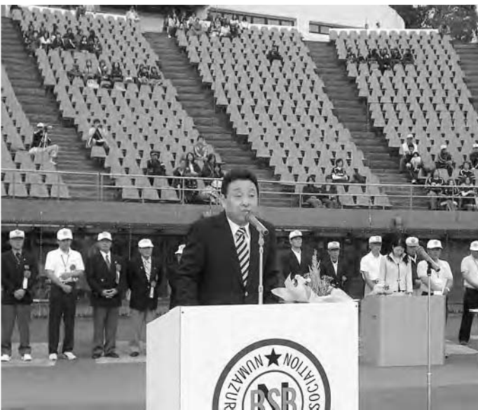
子供たちの真剣な顔が見つめます