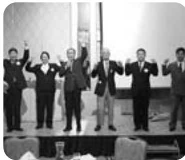
文字通り“新旧”ライオンによるローア