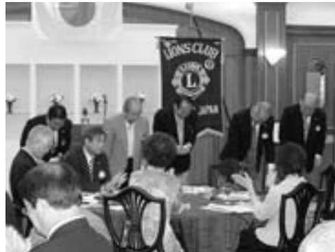
前3役に記念品贈呈、皆出席者の表彰