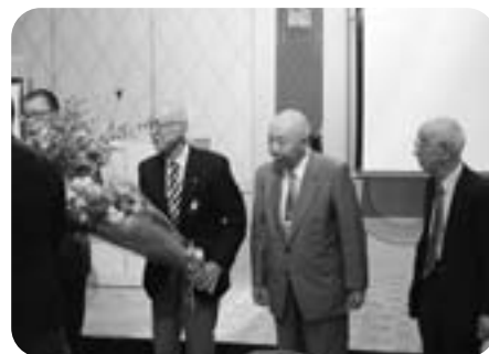
花束の贈呈 結成時のライオン