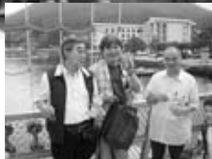
海賊船上にて夜の海の海賊? 3名