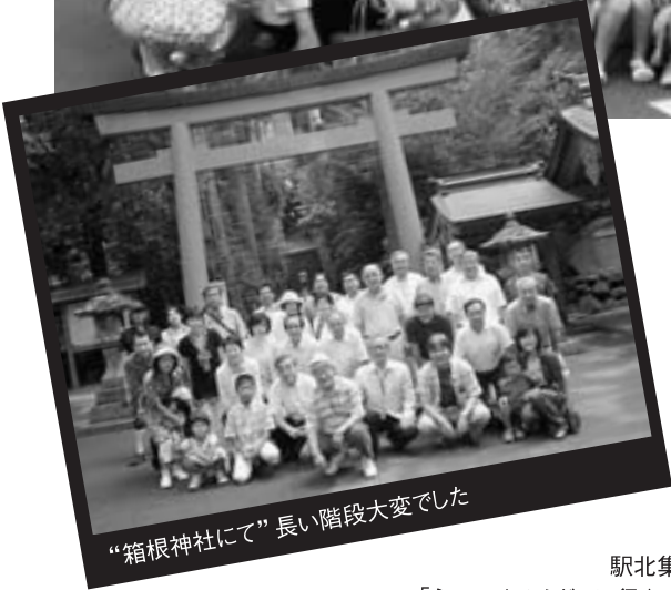
“箱根神社にて”長い階段大変でした

8月10日、沼津駅集合。バスに同乗して箱根へ移動例会。芦ノ湖上で風を受け、夏の日を楽しく過ごせました。