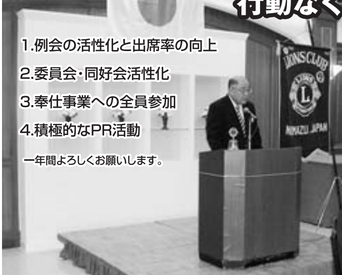
市川会長より出航挨拶