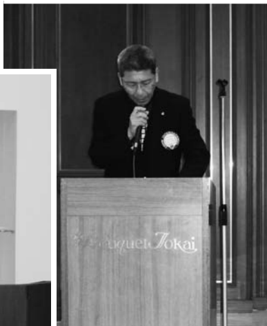
L.竹林よりCN50周年準備委員会アンケートについて