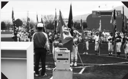
選手宣誓も初々しい野球少年