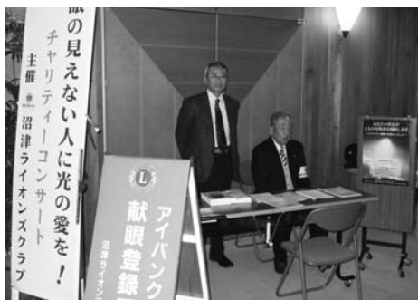
献眼登録受付コーナー