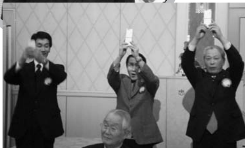
年男に記念品贈呈