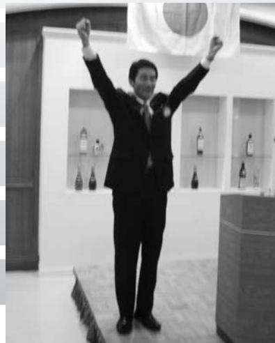
L.桜井わずか3ヵ月で社命により退会 残念