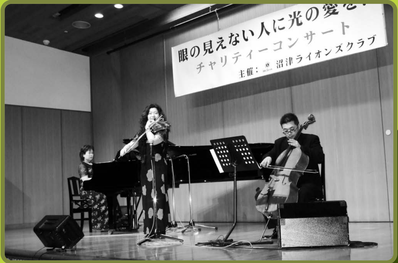
「チャリティコンサートより」