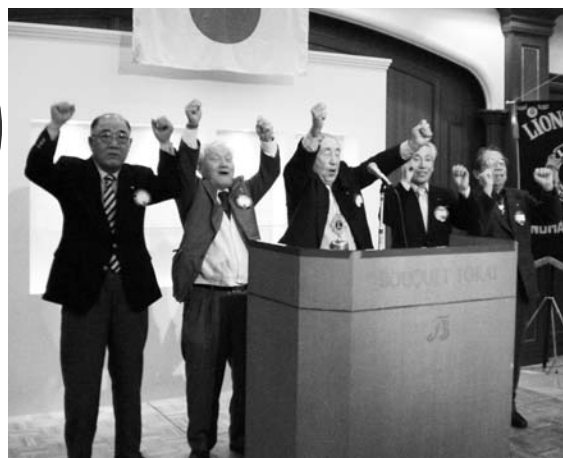
LCIF寄付者の皆さんによるローア