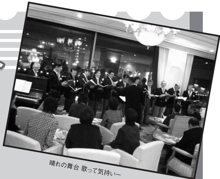
晴れの舞台 歌って気持ちいー