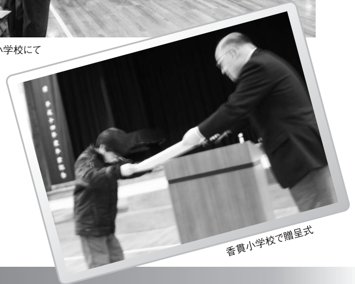
香貫小学校で贈呈式