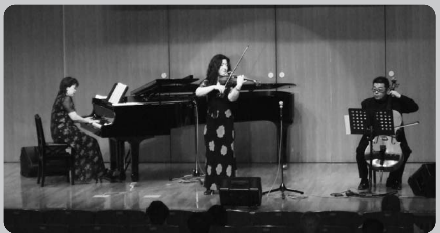
コンサートは数多くの観衆の中で行なわれました