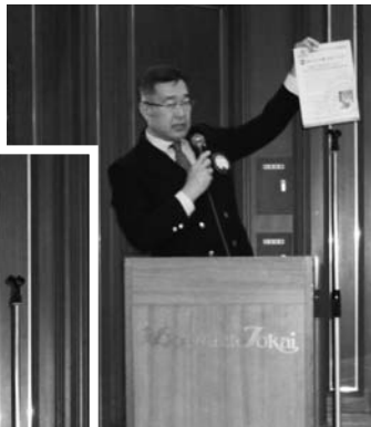
L.名取より5LC合同講演会について