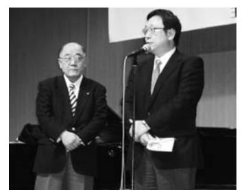
日本アイバンク協会に目録が贈呈されました