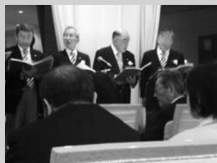
会長も歌う 幹事も歌う