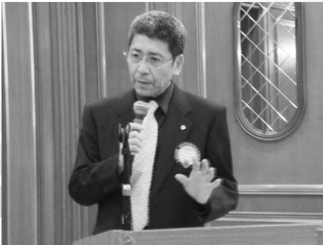
L.竹村CN50周年準備報告会より報告