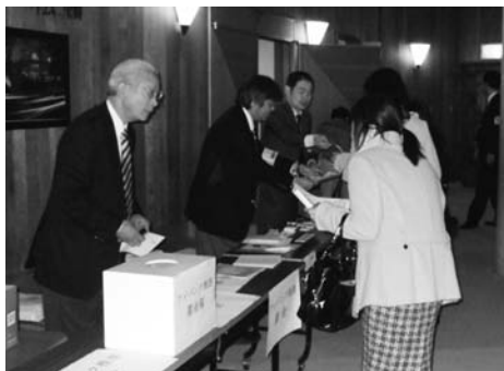
受付担当も忙しいです

千本プラザ大会議室においてチャリティコンサートが行なわれました。献眼登録受付も行なわれ、2件の登録がありました。