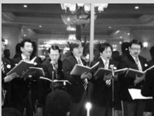
♪今日のはどの調子が良いぞー♪

3月26日東急ホテルにおいて、日頃研鑽を重ねているボーカルエルのコンサートが開宴された。