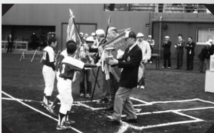
優勝旗・杯の返還