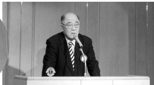
L.市川会長「原点にもどって」