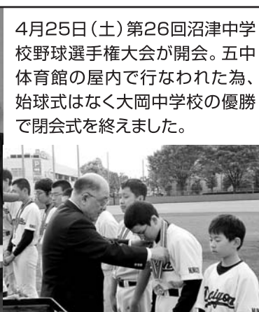
閉会式 準優勝だ胸を張れ!