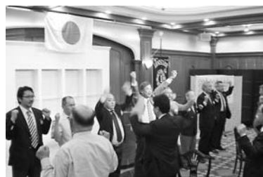
各委員長によるローア