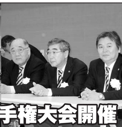
屋内の開会式は珍しいです