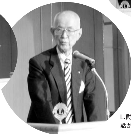
L.勸山 話が上手です