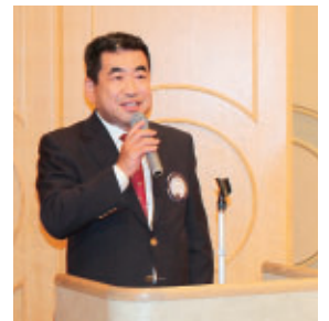
▲本当にお疲れさまでした