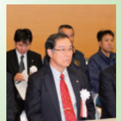
▲開会式に臨む芹澤会長