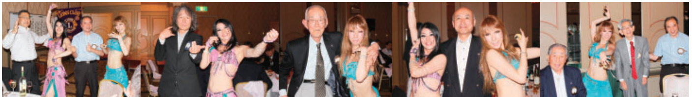
▲ベリーダンスで最高潮に盛りあがった懇親会、1年間の疲れもスットンダ!!