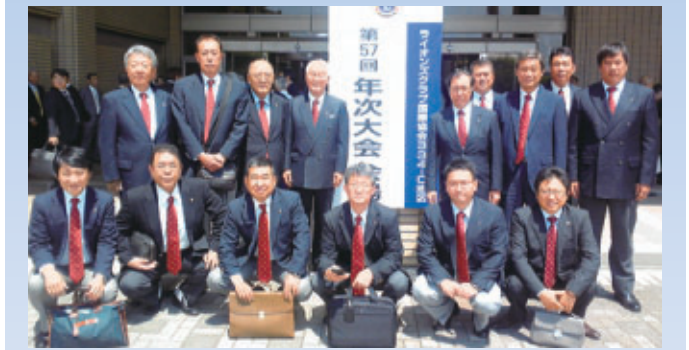
▲会場前に勢ぞろい

5月8日(日)裾野市民文化センターにおいて334-C地区第57回年次大会が開催されました。わが沼津ライオンズクラブは昨年にひきつづき、会員増強賞・献眼運動推進賞・アクティビティ賞の3つのアワードを受賞しました。