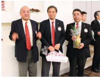
▲豪華景品をゲットして思わずニンマリ