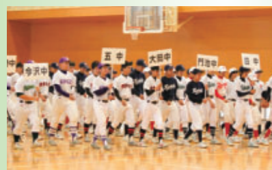
▲あいにくの雨で室内での選手入場

4月23日(土)沼津市中学校野球選手権大会兼ライオンズ旗争奪大会の開会式が雨天のため五中体育館で行われ、熱戦の幕が切っておとされました。5月1日(日)第一中学校の優勝をもって閉幕しました。