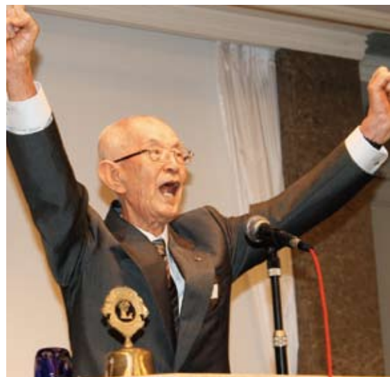
▲L.勸山の力強いローア