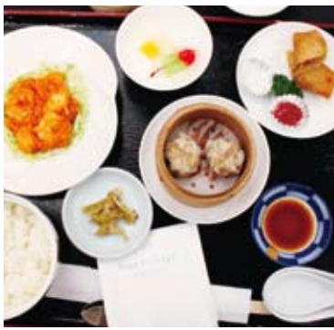
▲今回の例会食「中華」