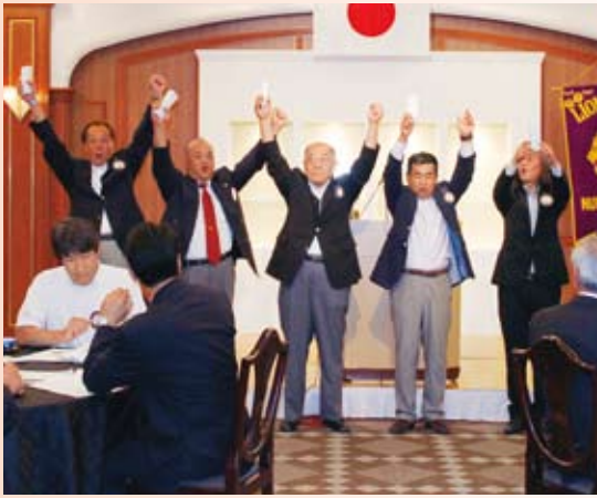
▲前年度例会皆出席の面々