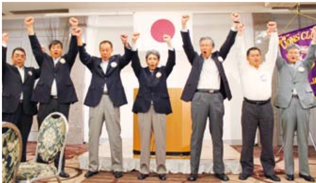
◀各委員長によるローア