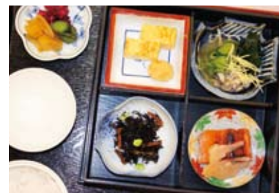
▲今回の例会食は「和食」