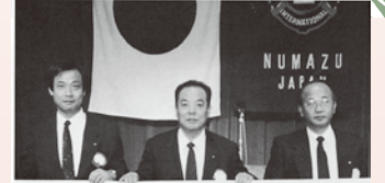
193-4 クラブスローガン

【ライオン歴】 1973.11 入会 1993～94 第35年度会長 1995～96 ZC 2004～05 地区キャビネット幹事