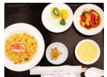
▲今回の例会食は中華でした