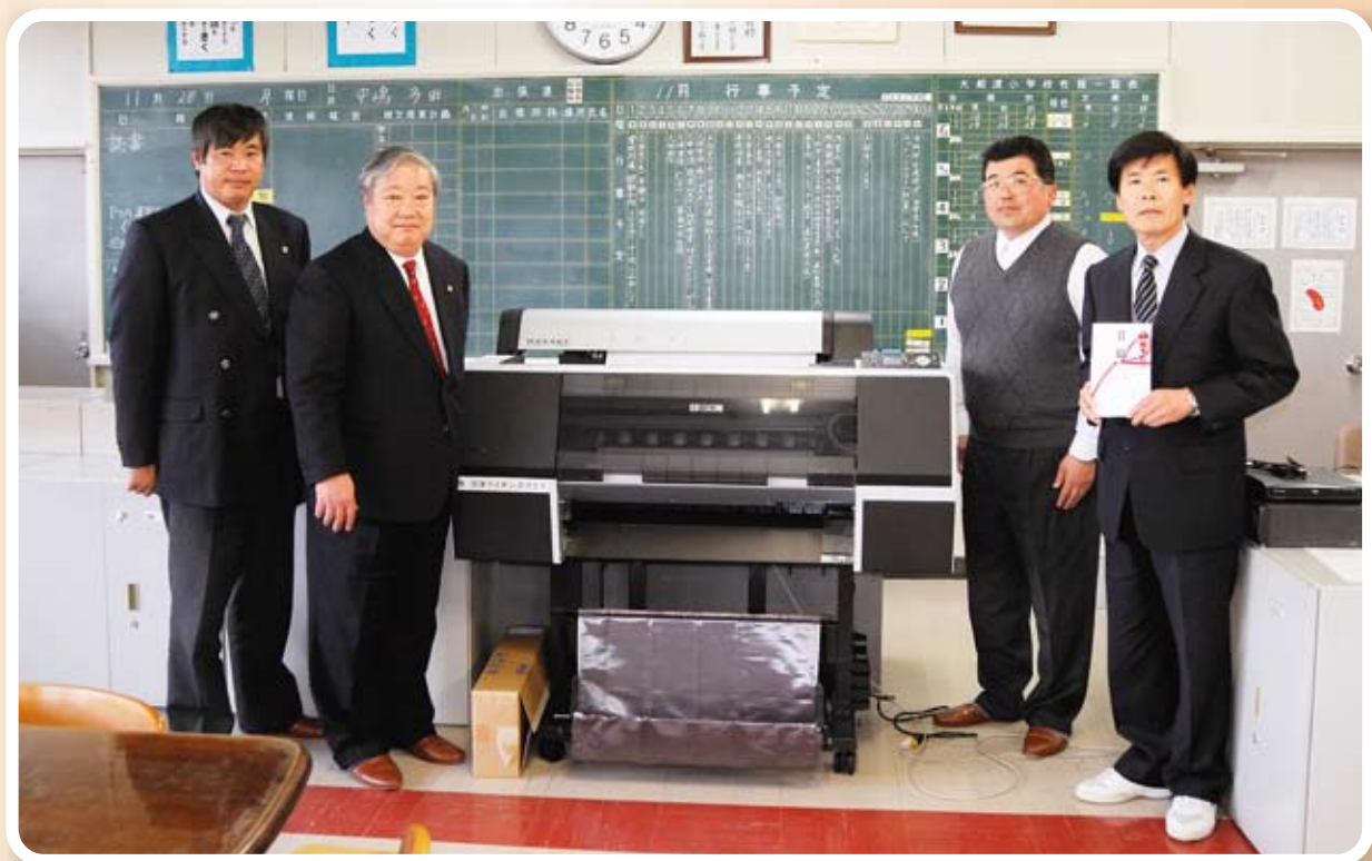
11月26日(土) 東日本大震災被災地青少年に対する支援として大船渡小学校へ大型プリンターを贈呈