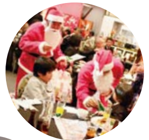
▲今年もライオン サンタが大活躍