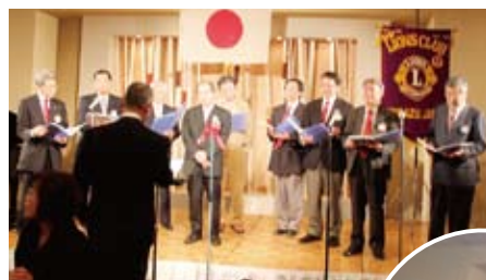
▲クリスマスの雰囲気盛り上げる ボーカル・エルの合唱