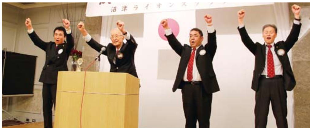
◀L.勸山を囲んで力強いローア