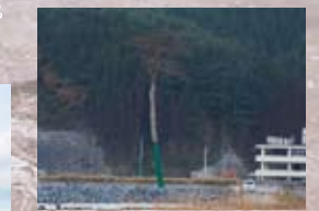
▲陸前高田「奇跡の一本松」