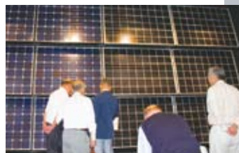
▲展示されたパネルに熱心に見入るメンバー