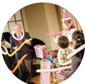
▲バルーンの首飾りが お似合いですL. 市川