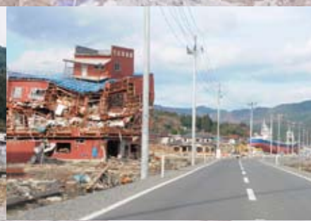
津波にすべてを押し流された陸前高田市内▶