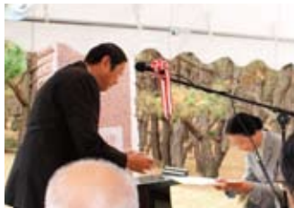
▲栗原沼津市長による感謝状伝達