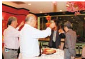
◀重慶茶楼での夕食