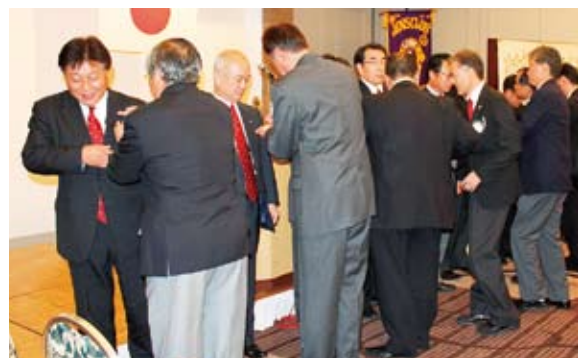
▲それぞれのスポンサーより新会員へのラベルピンの授与