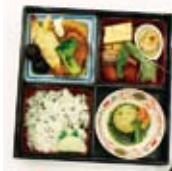
リバーサイドホテルにかわっての 初の例会食