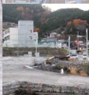
▲大船渡小学校と途切れた線路