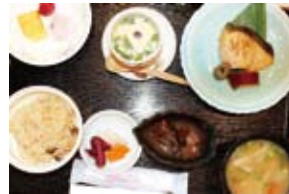
今回の例会食は和食でした▶