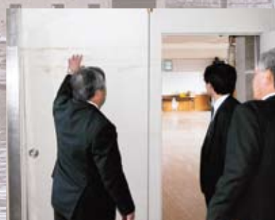
▲大船渡小校舎の壁面に残る津波痕