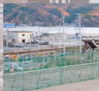
▲大船渡小学校2階から見渡した周囲の様子