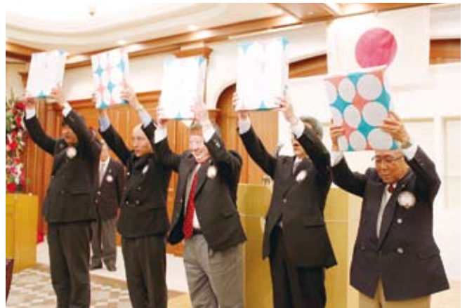
▲最優秀賞受賞者によるローア