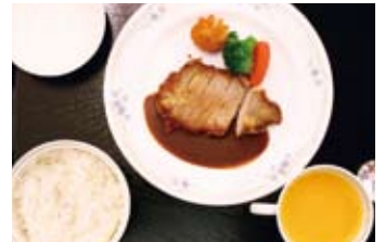
▲今回の例会食は洋食でした