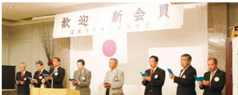
▲入会式の冒頭 ポーカル・エルのライオンズ・ヒムの斉唱で新会員を歓迎