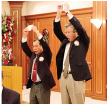
▲会員キー賞を受けたおふたりによるローア