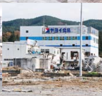
▲気仙沼市内の惨状