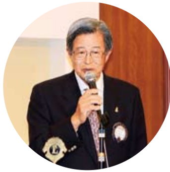
▲はめ字文の会 家元・ナイスショツ島とは私のことです