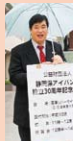
▲雨の中ご苦勞 さま