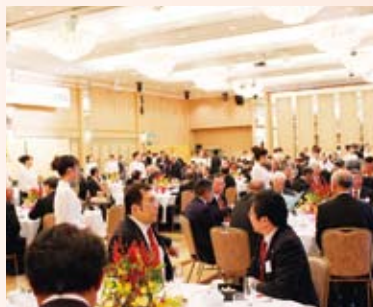
▲盛大に催された祝賀会