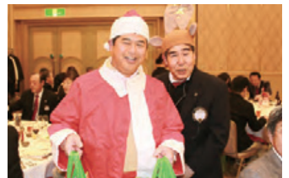
▲恰幅のよいサンタさんとトナカイさんからこどもたちへプレゼント