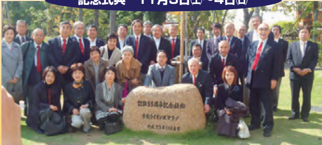
▲参加メンバーと同伴のご婦人方