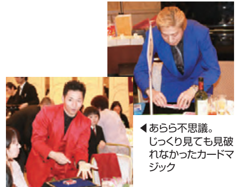
◀あら不思議。じっくり見ても見破れなかったカードマジック