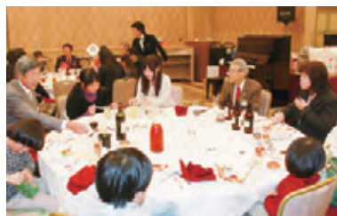
◀美味しいクリスマスディナーと楽しいアトラクションで、どのテーブルにも笑顔が溢れていました