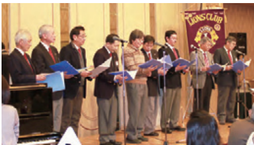
▲クリスマスの夜を彩るボーカルエルの美しいコーラス