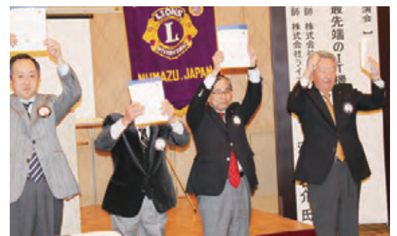
▲マイルストーン・シェブロン・アワードを受けた各ライオンによるローア