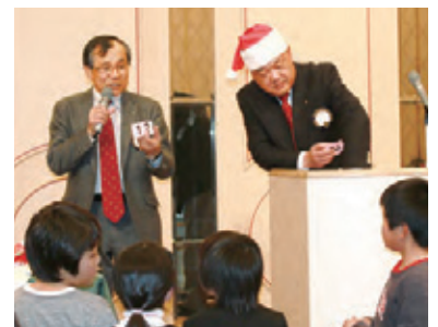
◀がんばってくれました塩崎計画大会委員長。おつかれさまでした