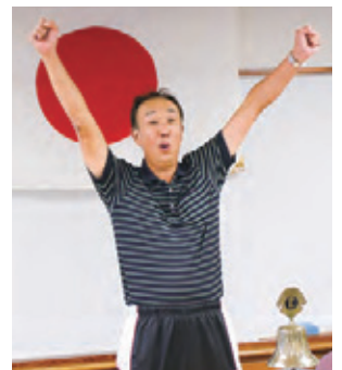
環境保全活動に飽くなき情熱を燃やす男—L.外のローア