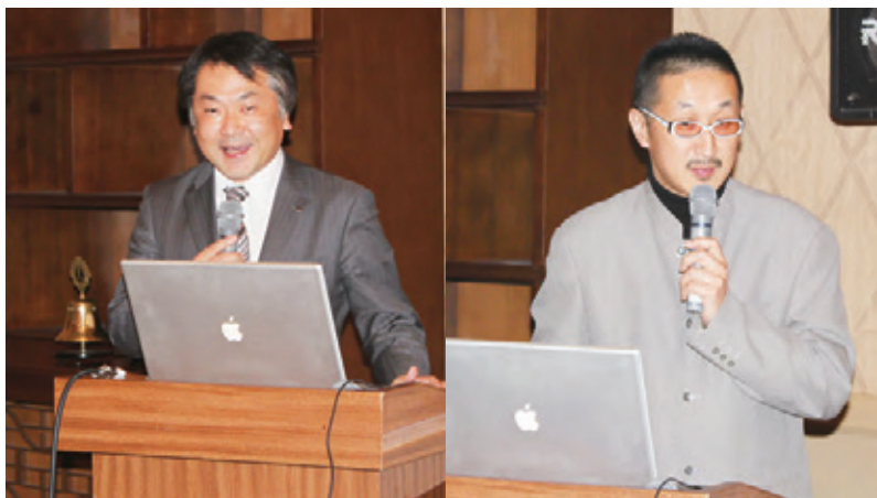
▲講師の(株)ライフ 大城様(左)と河合様(右)