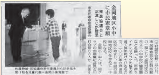
▲平成24年11月13日(火)沼津朝日