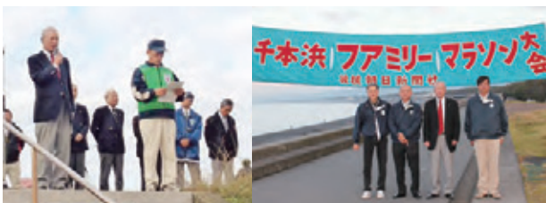
▲挨拶する赤堀会長と参加メンバー

11月18日(日)に開催された千本浜ファミリーマラソン会場に献眼登録コーナーを設け、参加者にアイバンク運動への理解と協力を呼び掛けました。