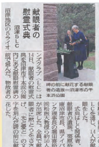
▲平成24年10月17日(水)静岡新聞