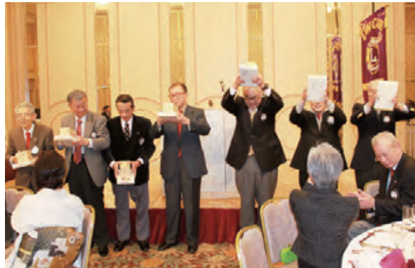
▲12月誕生月のみなさんのローア。おめでとうございます