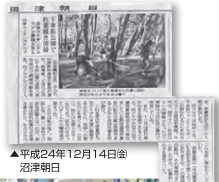
▲平成24年12月14日(金)沼津朝日