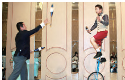
◀ジャグリングの妙技に会場はおおいに盛りあがりました