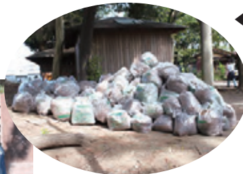
◀この膨大なゴミ袋の山が、この日の清掃奉仕活動の成果を物語っています