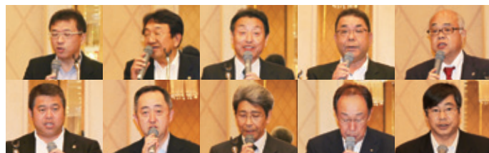
▲活動報告をするLT、TT及び各委員長