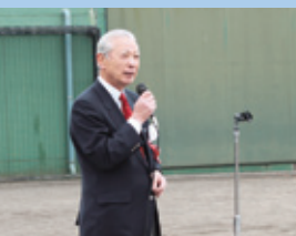
▲開会式で挨拶する赤堀会長