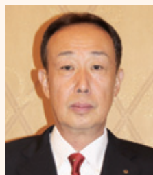
L. 外 信之

それぞれの担当例会は特色と会員の皆様がすぐに分かるよう十分に考えて行いたいと思ひます。