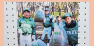
▲優秀賞受賞作品