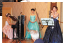
◀「DAHRIA」の演奏が祝宴の雰囲気盛り上げてくれました