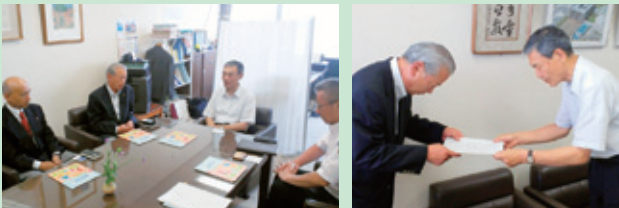
▲会長より教育長へ目録贈呈

「童話の花束」とは、JX日鉱日石エネルギー(株)が毎年童話の募集を行い、優秀作品(一般の部・中学生の部・小学生以下の部)の掲載に加え、ほのぼのとした絵画を加えた童話集です。今年は昨年に続き2回目の寄付。当ライオンズクラブが、活字離れている子供たちに読んで頂き、自ら童話を書いてみようと思う青少年の指導育成を願っての事業です。