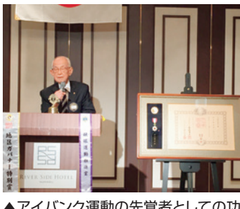
▲アイバンク運動の先覚者としての功績により叙勲。まことにおめでとうございます