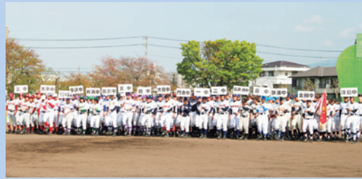
▲堂々の入場行進(開会式)