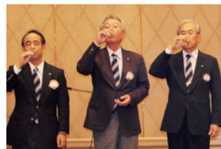
乾杯!!一年間で一番旨い酒ですネ!