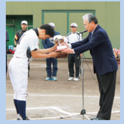
▲閉会式においてカップを授与する森会長