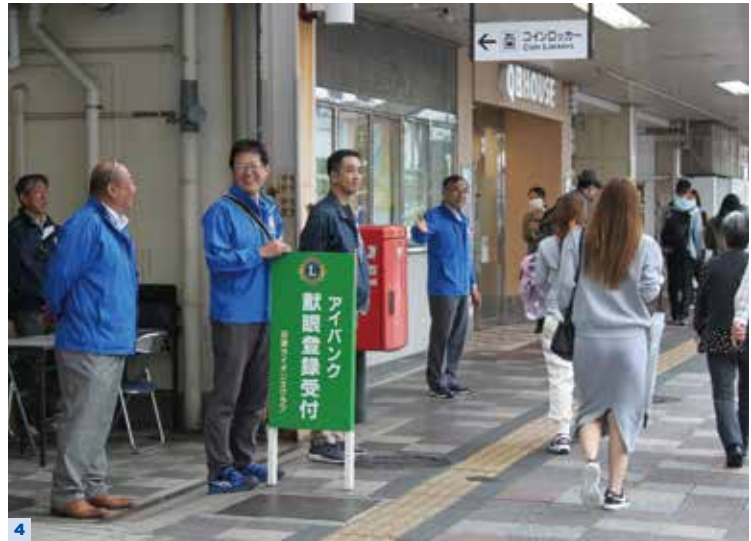
1 むまづ福祉まつりでは、多くの方に興味を持っていただくことができました。一人一人に丁寧に説明するメンバー 2 長岡委員長によるアクティビティの説明 3 プラザヴェルデでの出店の様子 4 沼津駅南口でも市民の皆様に献眼について説明させていただきました 5 視力福祉委員会によるローア。お疲れさまでした