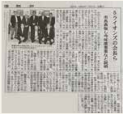
沼津朝日新聞 (7月15日)

沼津5ライオンズクラブ大嶽ZC、各クラブ会長が沼津市長へ今年度事業の説明に伺いました。それぞれの事業を遂行するにあたり、地域の皆さんとの連携が重要。今後の活動において、沼津市と協力しながら進めていくことなど語られました