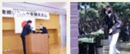
表4 参考資料 静岡県 HP