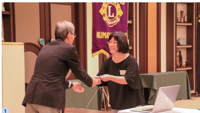
1 校長先生へ、ご要望いただいたレンズフルセットを贈呈させていただきました

2023年6月8日、沼津リバーサイドホテルにて6月第1例会が行われました。例会では、静岡県立沼津視覚特別支援学校への支援として今年は「シミュレーションレンズトライアルフルセット」を寄贈。贈呈式が行われました。贈呈式では校長先生より、生徒の見え方を先生が理解するためレンズが必要。指導に直結するので非常にありがたい。と感謝の言葉をいただきました。また、会員キー賞、LCIF 寄附者特別感謝アワードの贈呈、そして各委員会委員長より1年間の委員会活動報告がなされました。